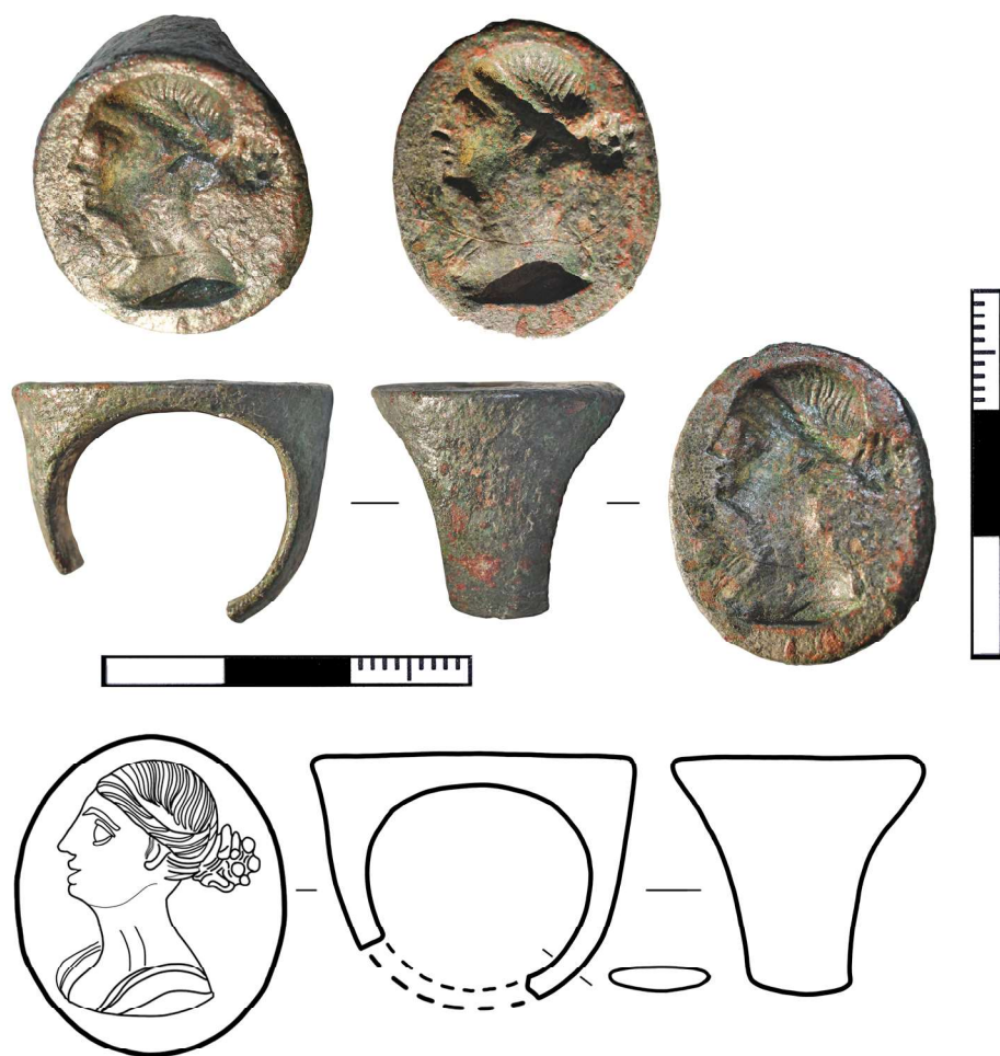
Рис. 3. «Группа усадеб Воскресенское б». Хозяйственная яма 4. Перстень бронзовый. Рисунки И.В. Рукавишниковой, фото Д.В. Бейлина