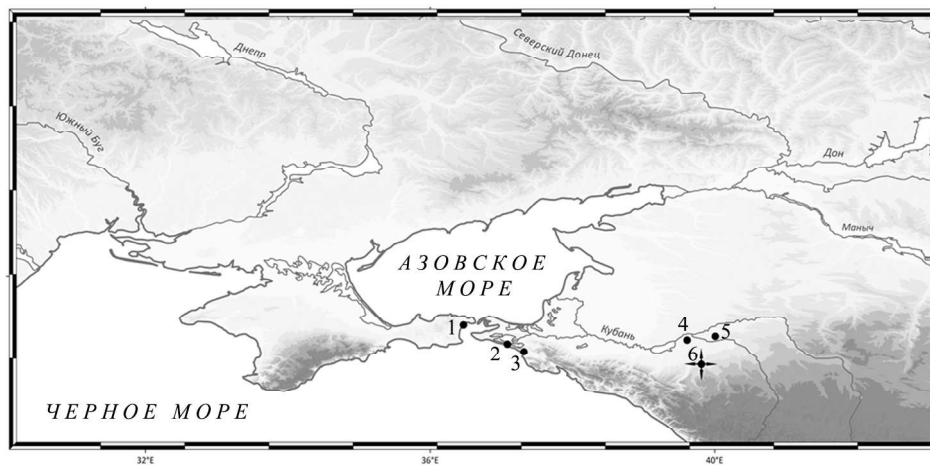
Рис. 5. Бронзовые перстни с портретом Арсинои III с пучками с округлыми выступами. Карта распространения. 1 – Пантикапей; 2 – Верхнее Джемте II; 3 – Воскресенское б; 4 – Псенафа; 5 – Тенгинская; 6 – «Майкоп». Карта М.Ю. Трейстера СМ. ЕГО ПРАВКИ, НЕ ПОЙМУ