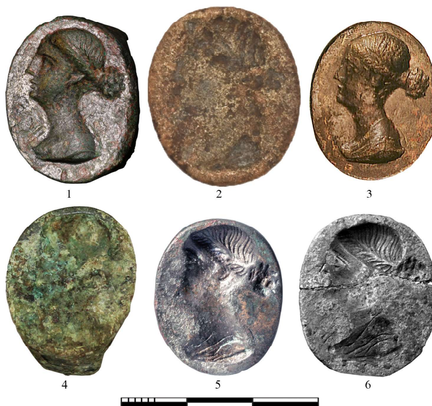
Рис. 4. Бронзовые перстни с портретом Арсинои III с пучками с округлыми выступами. 1 – «Группа усадеб «Воскресенское б»; 2 – усадьба Верхнее Джемте II; 3 – Пантикапей. ГЭ, инв. № П.1867.27; 4 – Псенафа. Погр. № 70; 5 – Тенгинская. Погр. № 140/1998; 4–5 – ГМВ; 6 –