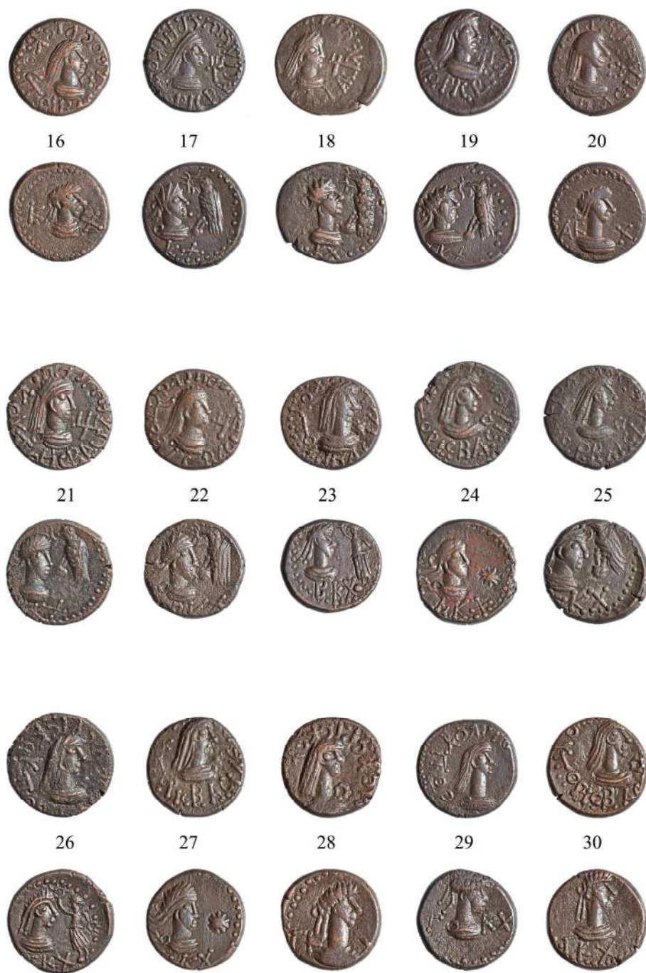
Рис. 3. Клад позднебоспорских статеров из Веселовки