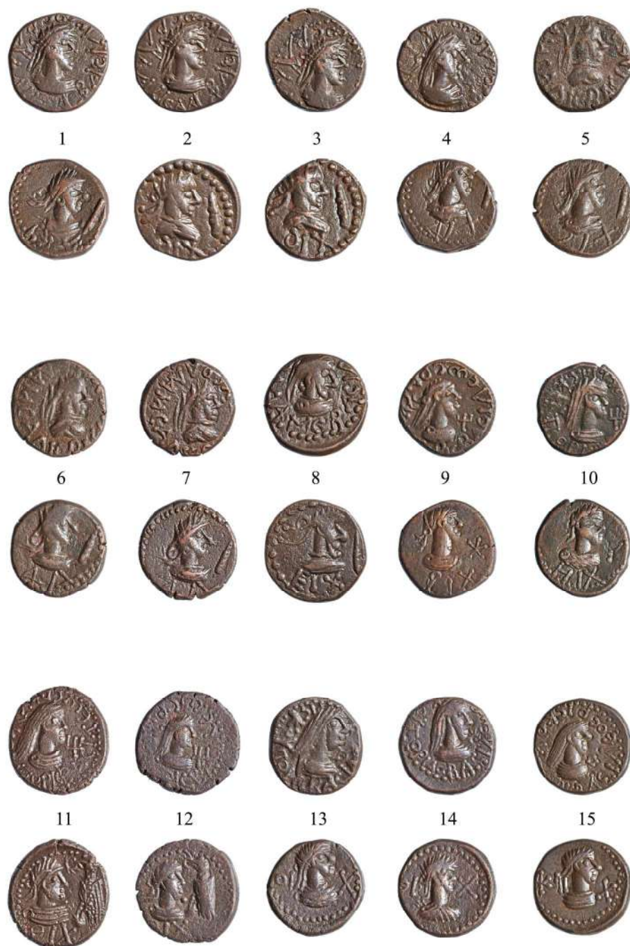
Рис. 2. Клад позднебоспорских статеров из Веселовки