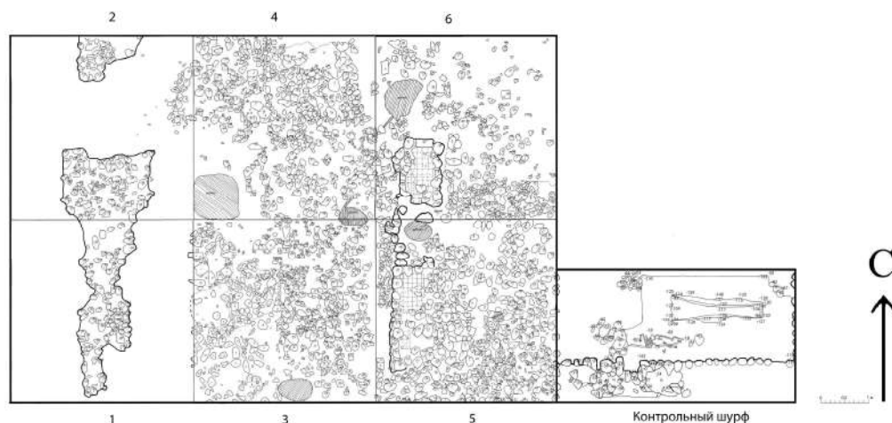
Рис. 3. Свинцовый саркофаг in situ

Вопрос датировки погребения при отсутствии инвентаря и сопутствующих находок может быть разрешен лишь в контексте истории формирования христианского комплекса. Традиционно возведение церкви относят ко второй половине V в. 19 Через непродолжительное время был пристроен нартекс. Сама церковь тоже имеет следы реконструкции. Скорее всего, перестройка храма связана с политикой Юстиниана I в регионе, направленной на укрепление границ Империи и идеологических позиций Ромейского мира на рубежах. Важнейшей частью этой политики являлось распространение христианства и укрепление позиций Церкви в регионах. Одним из таких центров влияния, без сомнения, являлся позднеантичный-раннесредневековый Гиенос. Косвенным подтверждением этого служат многочисленные находки при его раскопках фрагментов архитектурных деталей из проконесского мрамора, которые были частью внутреннего убранства базилики и заменили более дешевые архитектурные элементы из местного камня.