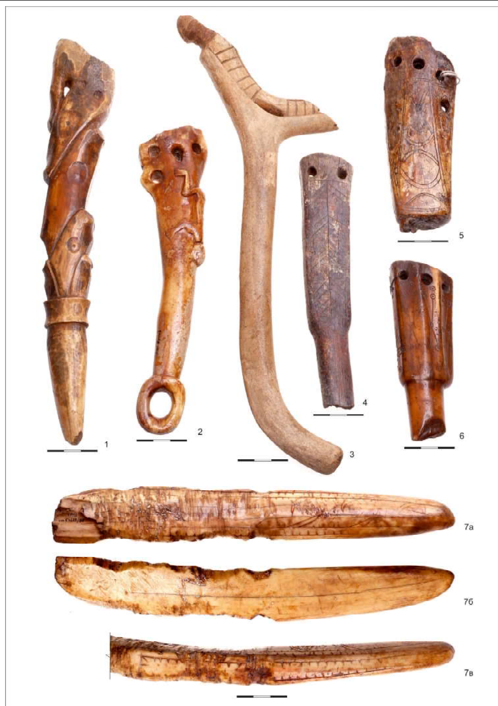
Рис. 5. Рукояти мотыг декорированные. 1–3 – могильник Эквен: 1 – погр. 222; 2 – погр. 319; 3 – погр. 313; 4, 5 – поселение Эквен, подъемный материал; 6 – Наукан (?); 7 – поселение Пайпельгак, рабочая часть мотыги. 1, 2, 4–7 – клык моржа; 3 – олений рог. ГМВ: 1 – 112 ДР–IV, КП 42366; 2 – 791 ДР–IV, КП 50344; 3 – 917 ДР–IV, КП 51558; 4 – 669 ДР–IV, КП 49176; 5 – КП 53753/716; 6 – КП 58839/23; 7 – КП 53627/80