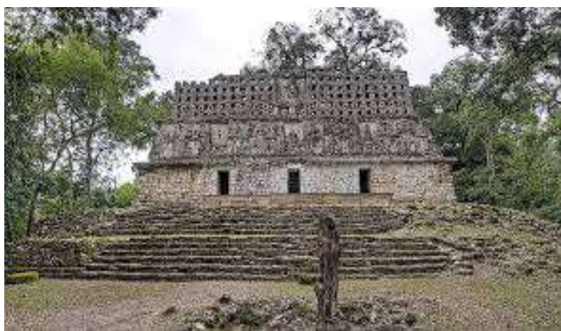
Рис. 5. Стела 31 из Йашчилана, Чьяпас, Мексика (по: Helmke 2017, 21)