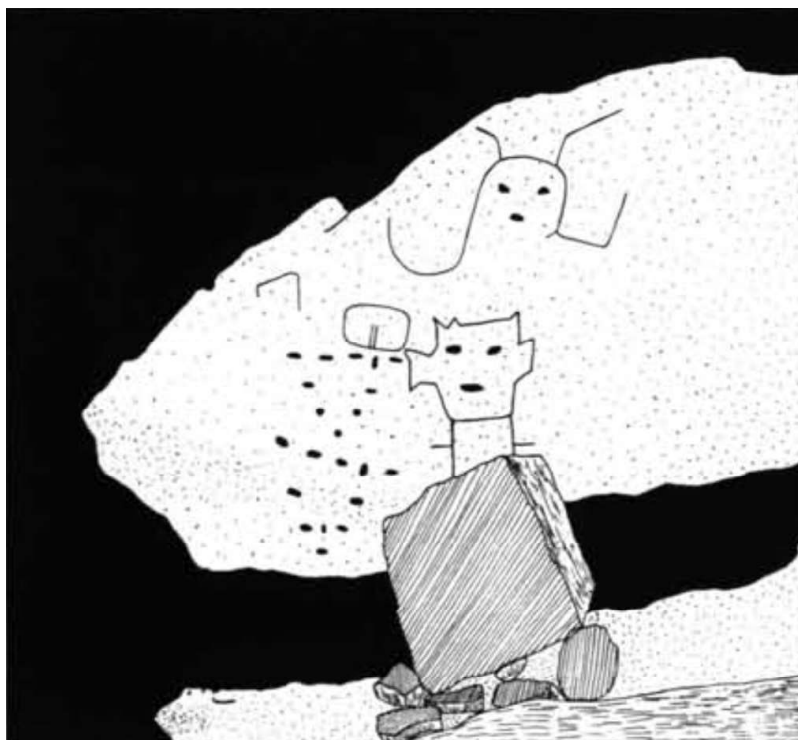
Рис. 1. Панель 7, пещера Актун-Чен-Чин (по: Bonor Villarejo, Sanchez y Pinto 1991, 42)