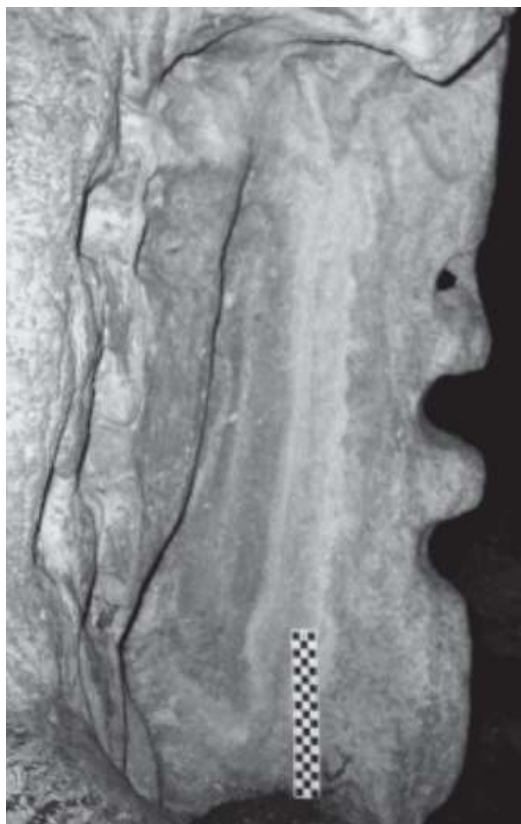
Рис. 4. Скульптура 4, пещера Актун-Чапат (по: Griffith, Jack 2005, 7)