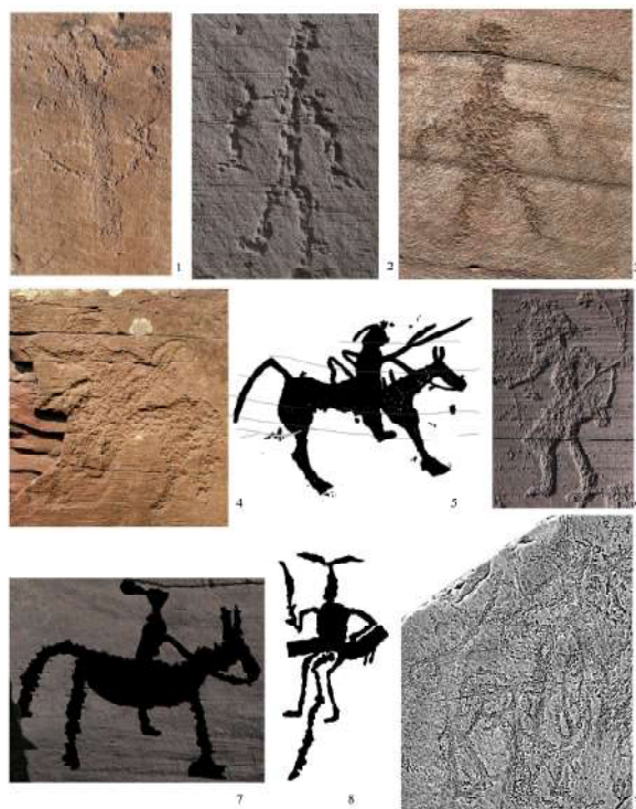
Рис. 2. Варианты оформления голов у антропоморфных персонажей тесинского времени. 1, 9 – плиты тагарских курганов Тепсейского могильника (рендер 3D-модели, выполненной лабораторией RSSDA); 2 – Тепсей III; 3, 6 – Усть-Туба; 4, 7 – Тепсей II; 5 – Лынищенская писаница (по: Миклашевич 2012); 8 – курган Туранского могильника