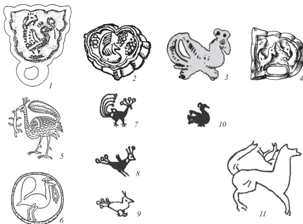
Рис. 3. «Фениксы» оригинальной иконографии и композиции в искусстве Саяно-Алтая с прилегающими территориями (1–4) и «аналогии» (5–11). 1 – Шанда (контактная копия); 2 – Совхоз 499; 3 – Решетниково; 4 – Хемчик Бом II. 1–4 – по: Король 2013; 5, 6 – по: Вишневская 2007; 7–10 – по: Vernier, Bruneau 2016; 11 – по: Дэвлет 2013