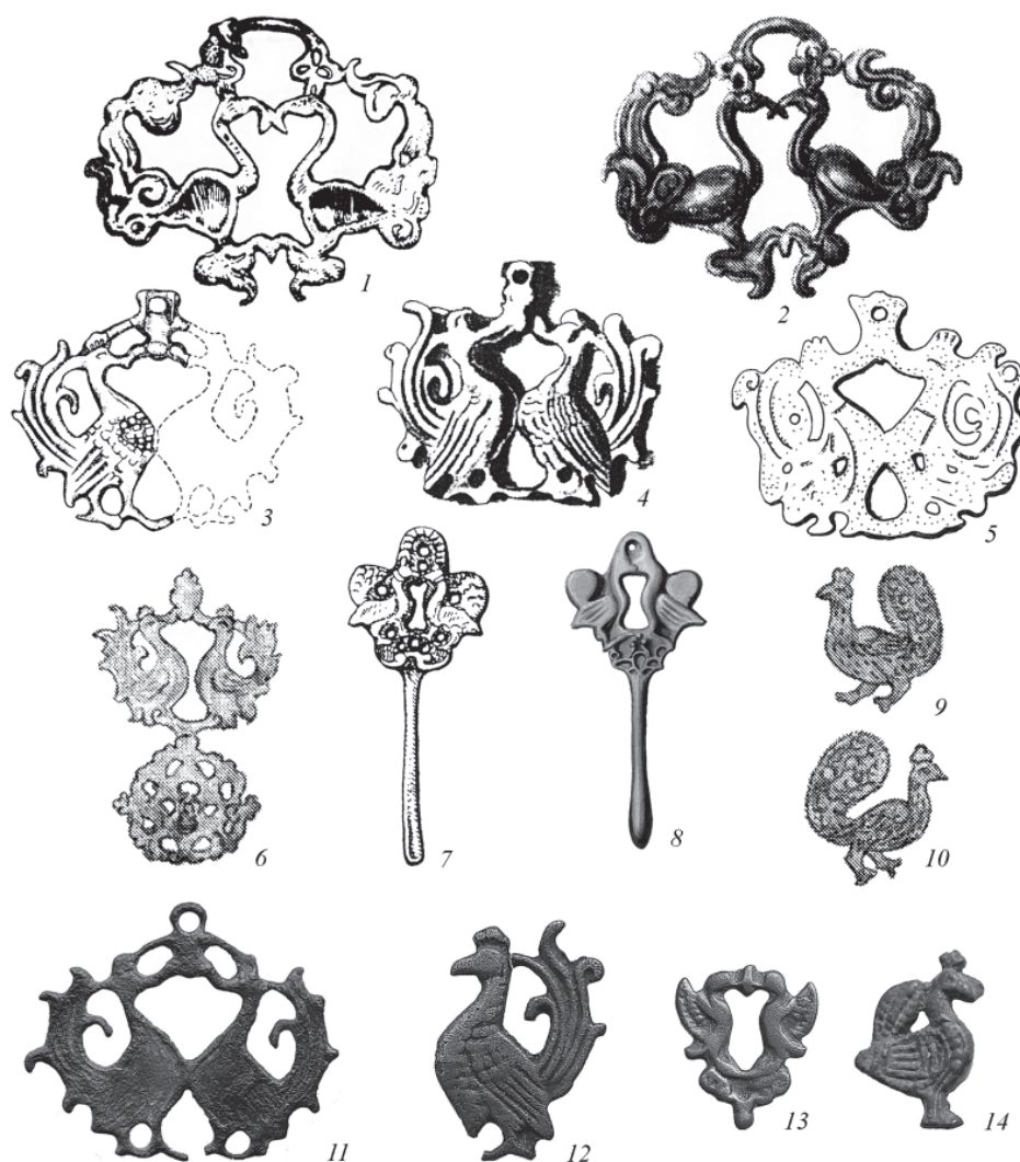
Рис. 2. Мотив противостоящих птиц и одиночные фигурки в искусстве Саяно-Алтая с прилегающими территориями (1–10) и Северного Тянь-Шаня (11–14). 1 – Ур-Бедари; 2, 6, 9, 10 – «из сибирских курганов», Алтай?; 3 – Сандыккала; 4 – из «могил между Обью и Иртышом»; 5 – сборы И.А. Лопатина в Минусинском крае; 7 – Корболиха II; 8 – Алтай, из альбома В.В. Радлова 1861 г. 1 – по: Елькин 1970; 2, 6, 9, 10 – по: Формозов 1986; 3 – по: Акишев 1987; 4 – по: Миллер 1937; 5 – по: Король 2013; 7 – по: Могильников 2002; 8 – по: Король 2008; 11–14 – по: Камышев 2023