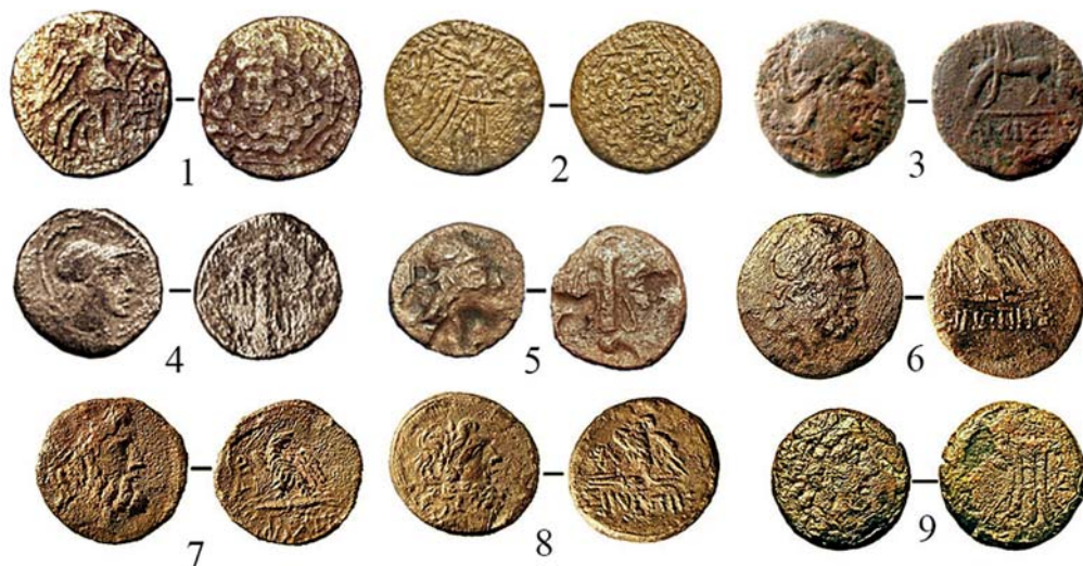
Рис. 2. Монеты Митридата Евпатора с памятников Северо-Западного Крыма: 1–5 – Амис; 6–8 – Синопа; 9 – Пантикапей

Fig. 2. Coins of Mithradates Eupator in the Northwestern Crimea: 1–5 – Amisus; 6–8 – Sinope; 9 – Panticapaeum