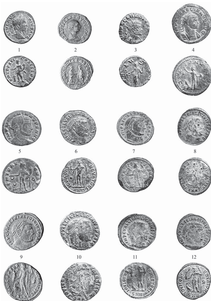
Рис. 3. Ильичевский клад 2018 г. Fig. 3. The Il'yich 1 2018 hoard.