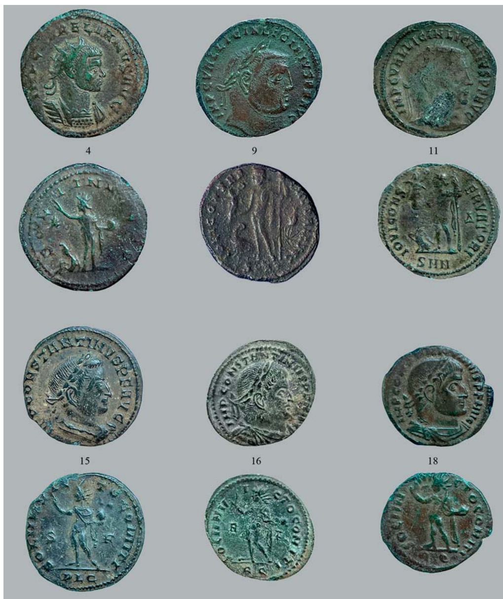
Рис. 2. Монеты из клада 2018 г. Fig. 2. Coins from the Ilyich 2018 Hoard.