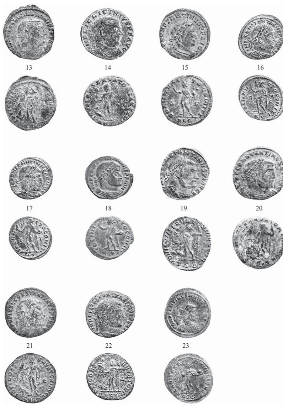
Рис. 4. Ильичевский клад 2018 г. Fig. 4. The Ilyich 1 2018 hoard.