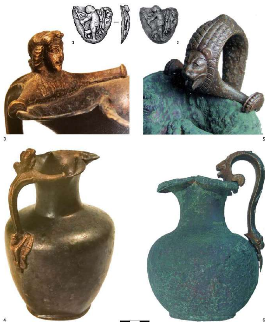
Рис. 5. Бронзовые ойнохои типа Eggers 124 / Nuber D / Tassinari D2111a–с–2112 1 и Eggers 125 / Nuber E / Tassinari D2300. 1–2 – Херсонес. Раскопки К.К. Косцюшко-Валюжинича. Севастополь, ГИАМЗХТ, инв. № 5106; 3–4 – поселение Владимирское № 2. Грунтовый некрополь. Земляной склеп, раскопанный в 1949 г. Краснодар, КГИАМЗ, инв. № 1877/8; 5–6 – Усть-Альминский могильник. склеп № 620/1996. Бахчисарай, БИКАМЗ. КП-9106/315. Фото (по: 1–2 – Дорошко 2016, 3–4 – Кат. Mannheim 1989; 5–6 – Кат. Киев 2005).

Fig. 5. Bronze oinochoes of the Eggers 124 / Nuber D / Tassinari D2111a–с–2112 and Eggers 125 / Nuber E / Tassinari D2300 types. 1–2 – Chersonese. Excavations by K.K. Kostyushko-Valyuzhinich. Sevastopol, State Historical and Archaeological Museum-Reserve “Tauric Chersonese”, inv. no. 5106; 3–4 – settlement Vladimirskoe no. 2. Burial ground. Earthen vault, 1949 excavations. Krasnodar, State Historical-Archaeological Museum-Reserve, inv.-no. 1877/8; 5–6 – Ust'-Al'ma necropolis. Vault no. 620/1996. Bakhchisaray, Historical-Cultural and Archaeological Museum-Reserve, inv. no. KP-9106/315. Photos (after: 1–2 – Doroshko 2016; 3–4 – Kat. Mannheim 1989; 5–6 – Кат. Киев 2005).