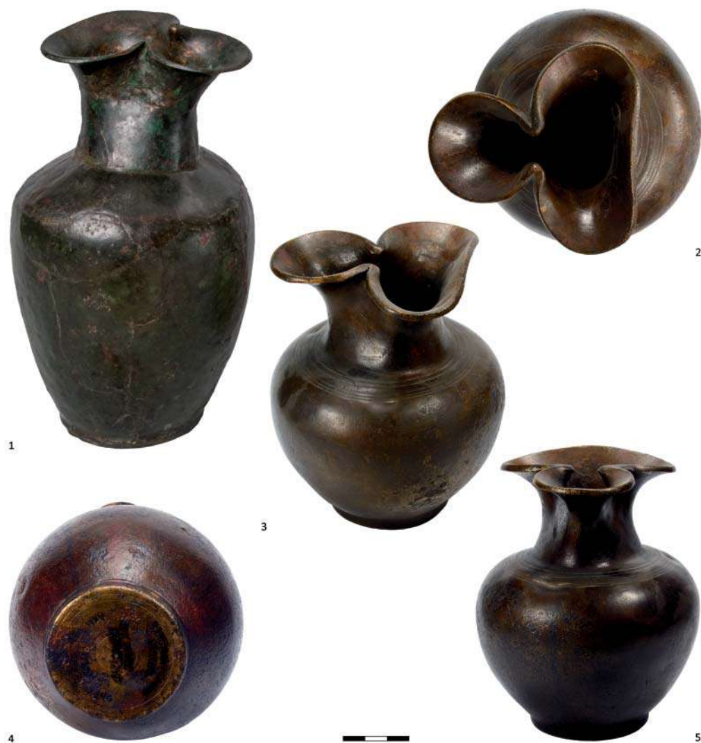
Рис. 6. Бронзовые ойнохои типа Eggers 124 / Nuber D / Tassinari D2111a–с–2112 1 и Eggers 125 / Nuber E / Tassinari D2300. 1– Чернышев-І. Курган № 5. Погребение № 92. Москва, ГМВ, инв. № КП-37105, Чернышев-1985, 960/М-4; 2–5 – Валовый-І. Курган № 9/1987. Погребение № 1. Азов, АИАПМЗ, инв. № 25309/240.

Fig. 6. Bronze oinochoes of the Eggers 124 / Nuber D / Tassinari D2111a–с–2112 and Eggers 125 / Nuber E / Tassinari D2300 types. 1– Chernyshev-I. Burial mound no. 5. Burial no. 92. Moscow, State Orient Museum, inv.- no. KP-37105, Chernyshev-1985, 960/M-4; 2–5 –Valovyy I. Burial mound no. 9/1987. Burial no. 1. Azov, Historical-archaeological and paleontological museum-reserve, inv.-no. 25309/240.