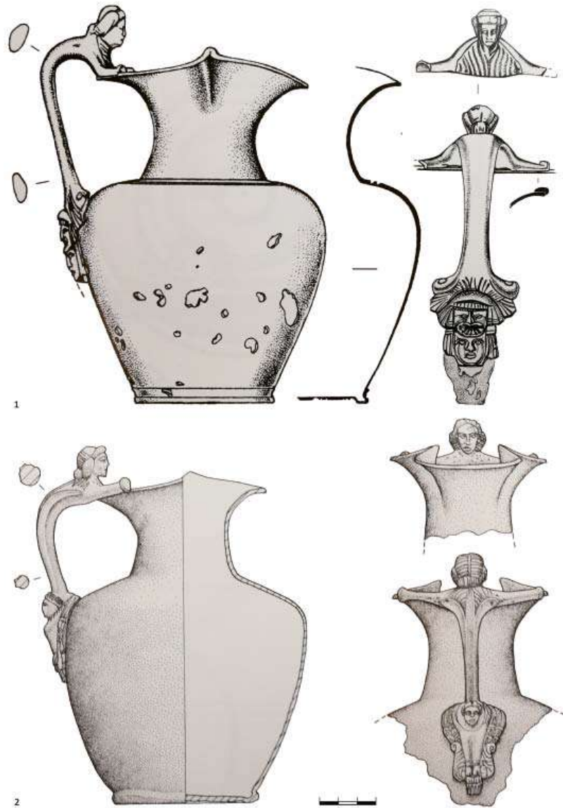
Рис. 3. Бронзовые ойнохои типа Eggers 124 / Nuber D / Tassinari D2111a–с–2112 1 – Цветна. Раскопки кургана крестьянами, исследование А.А. Бобринским, 1896 г. Санкт-Петербург, Гос. Эрмитаж, инв. № 2022/1; 2 – поселение Владимирское № 2. Грунтовый некрополь. Земляной склеп, раскопанный в 1949 г. Краснодар, КГИАМЗ, инв. № 1877/8. Рисунки (по: Marčenko, Limberis 2008).

Fig. 3. Bronze oinochoes of the Eggers 124 / Nuber D / Tassinari D2111a–с–2112 type. 1 – Tsvetna. Excavations of the burial mound by the peasants, supplementary excavations by A.A. Bobrinskiy, 1896. Saint Petersburg, State Hermitage, inv.-no. 2022/1; 2 – settlement Vladimirskoe no. 2. Burial ground. Earthen vault, 1949 excavations. Krasnodar, State Historical-Archaeological Museum-Reserve, inv.-no. № 1877/8. Drawings (after: Marčenko, Limberis 2008).