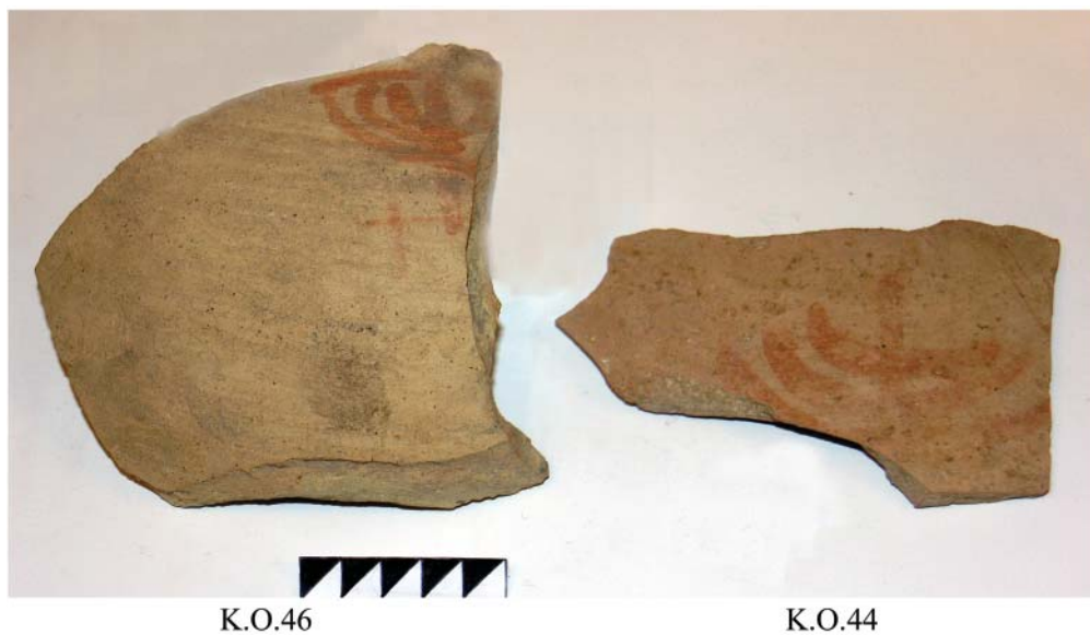
Рис.3. Дипинти красной краской на стенках амфор с изображением менор из ямы № 26. Fig.3. Menorah-dipinti with red paint on amphorae walls from Pit No. 26.