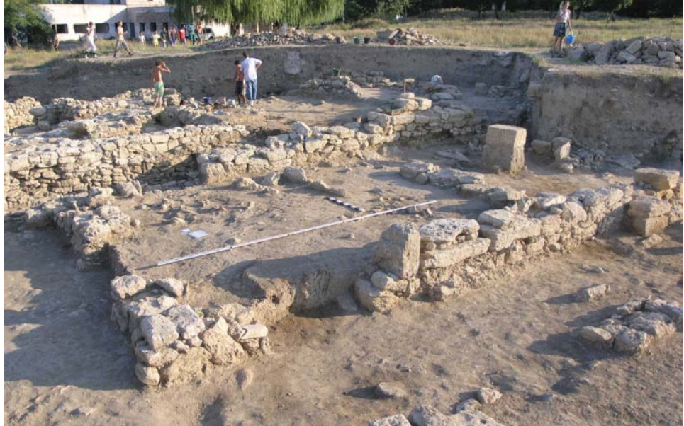
Рис.1. Здание святилища в центральной части верхнего города Тиритаки. Вид с ЮВ. Fig.1. Sanctuary Building in the central part of the upper part of Tyrिताce. View from the southeast.