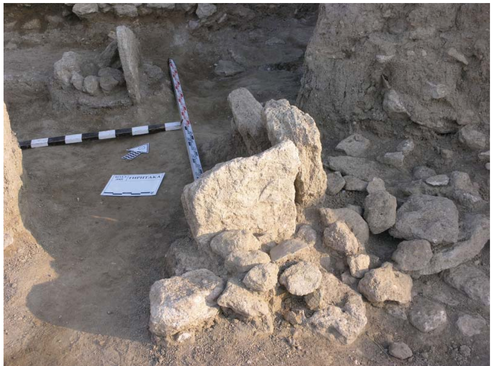
Рис.2. Алтари в помещении II святилища. Вид с ЮВ. Fig.2. Altars in the Room 2 of the Sanctuary. View from the southeast.