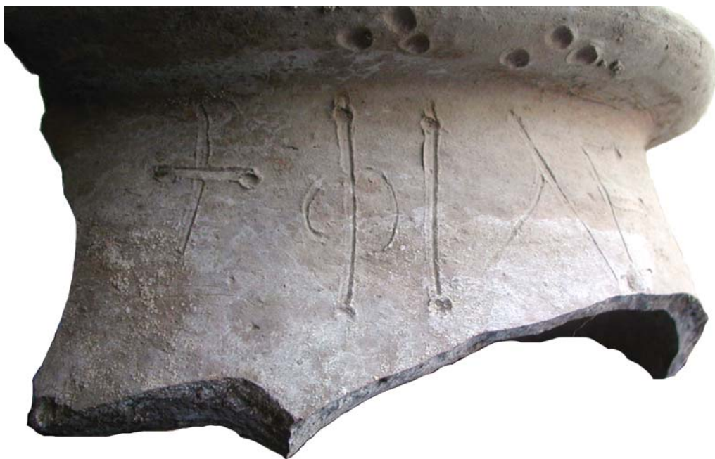
Рис.5. Верхняя часть пифоса с граффити в виде креста и греческой надписи. Fig.5. Pythos' upper part bearing a graffiti in form of the cross and Greek inscription.

публичную религиозную практику: забрасываются языческие святилища, и под опекой Византии начинается строительство христианских базилик в боспорских городах. В то же время в частной жизни в той или иной степени сохранились прежние языческие верования и обряды. Отсюда период второй половины V – начала VI вв. можно рассматривать как время перехода общественной культовой жизни от языческих обрядов к христианским литургиям 17 .