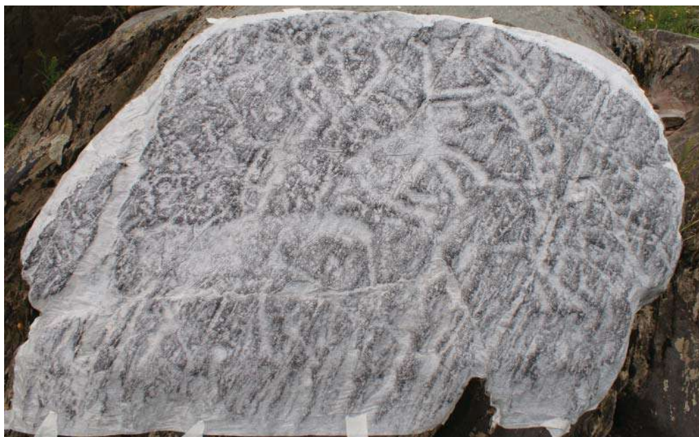
Рис. 3. Микалентная копия плоскости НР VII.2 Fig. 3. Mica paper copy the panel NR VII.2