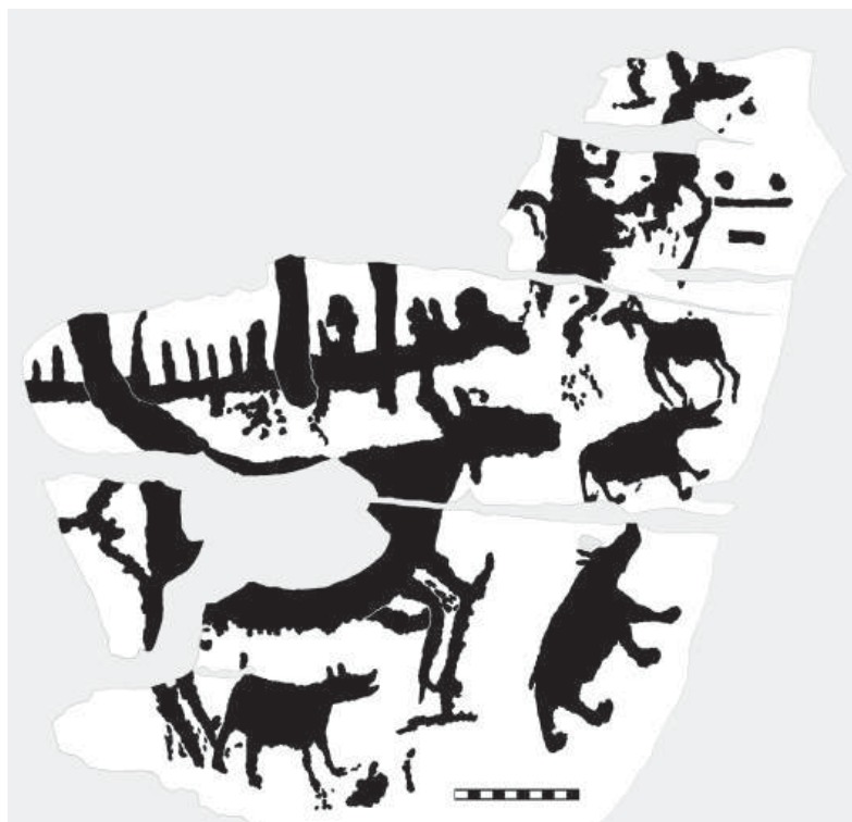
Рис. 5. Прорисовка плоскости NP IV.3 Fig. 5. Drawing copy of the panel NR IV.3

дух воды Ид Ерв, железная щука Есядавы Пыри 4 . На священном лабазе лесных ненцев на р. Пусым-то имелся сундучок с фигуркой Щучьего бога 5 . В одном из ненецких сказаний старший из совладок Нижнего мира после его убийства героем превращается в щуку 6 . Интересный сюжетный поворот, при котором образ щуки обретается владыкой царства смерти после его собственной смерти.