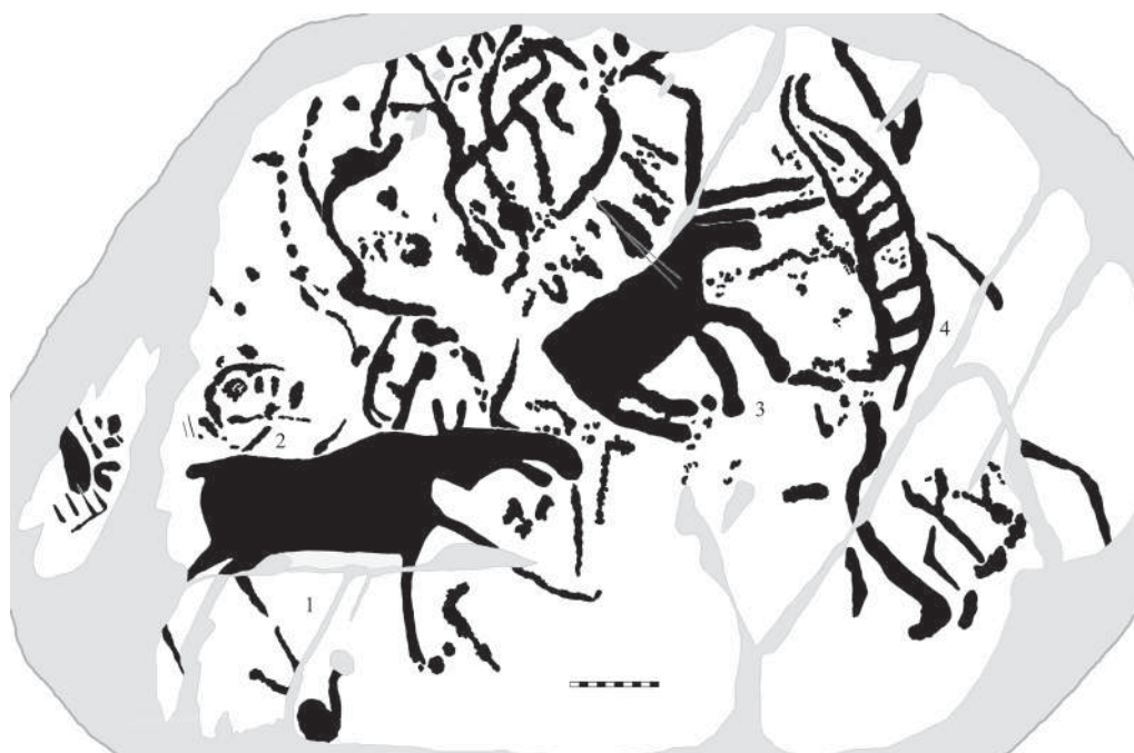
Рис. 4. Прорисовка плоскости НР VII.2 Fig. 4. Drawing copy of the panel NR VII.2