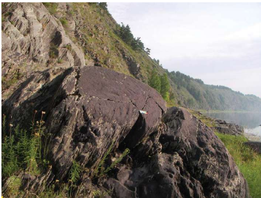
Рис. 1. Фото валуна с петроглифами НР VII.2 Fig. 1. Photo of the boulder with petroglyphs NR in VII.2