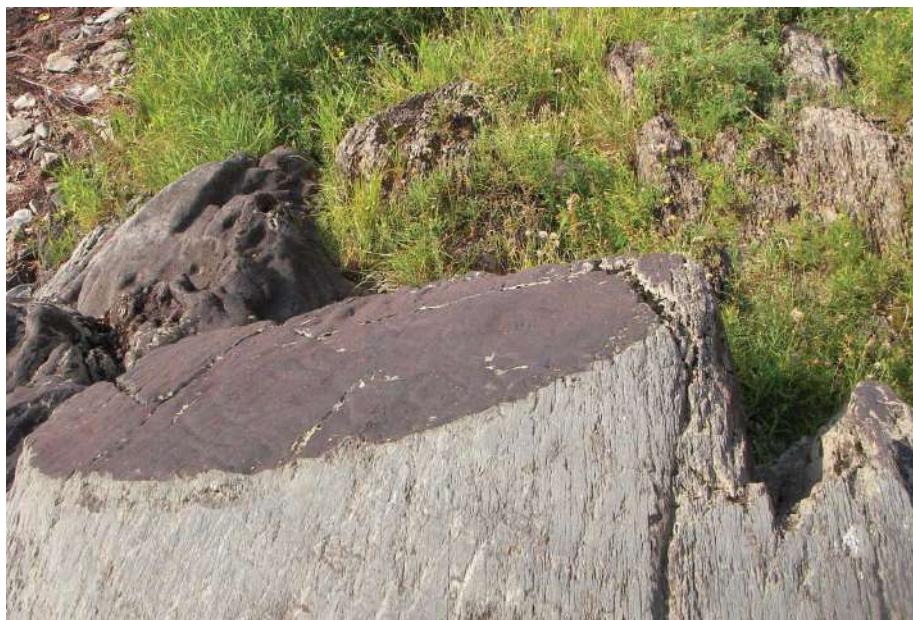
Рис. 2. Фото валуна с петроглифами НР VII.2, вид сверху Fig. 2. Photo of the boulder with petroglyphs in NR VII.2, top view