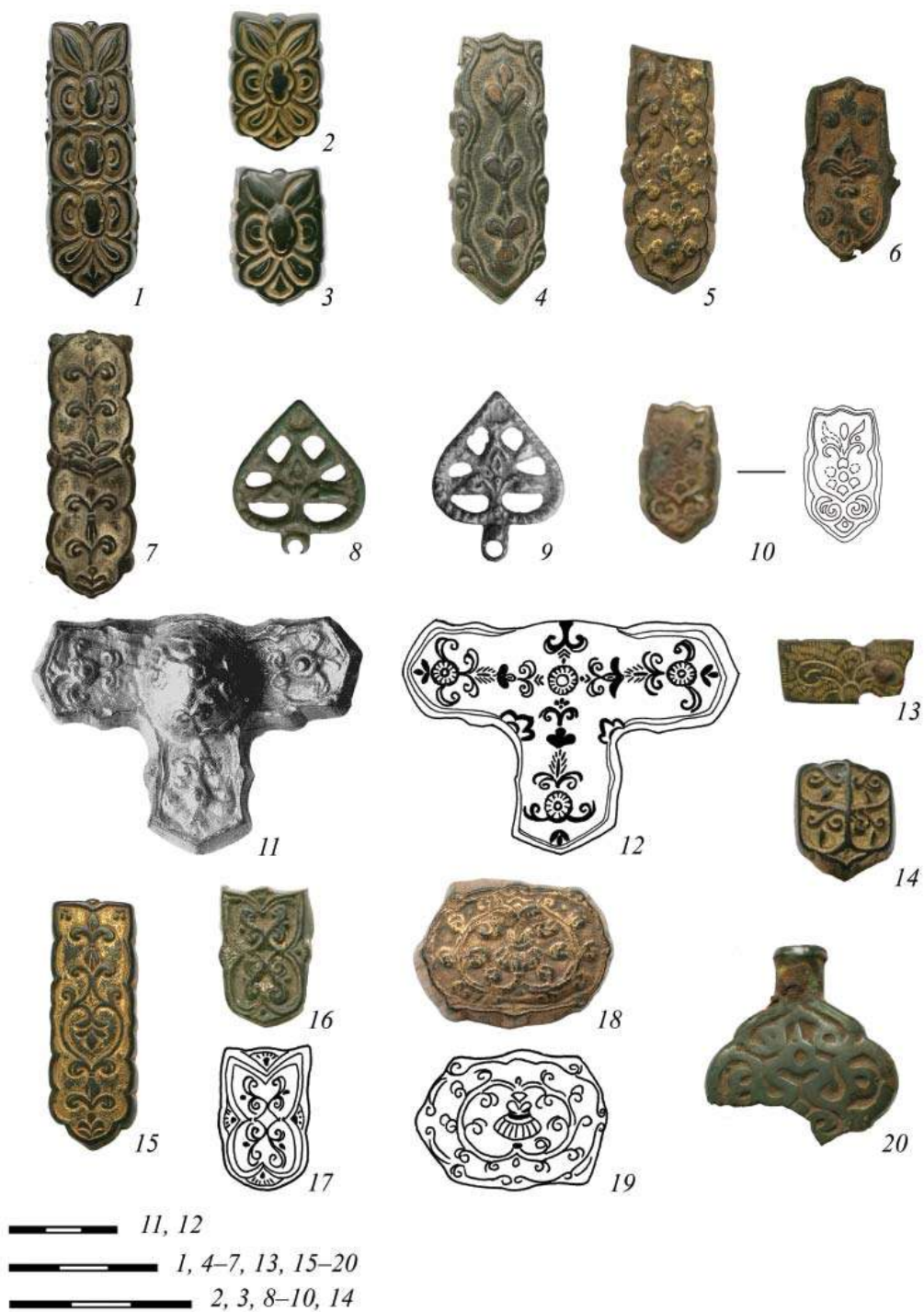
Рис. 2. Растительный декор (1-8, 10, 11, 13-16, 18, 20) и аналогии (9, 12, 17, 19)