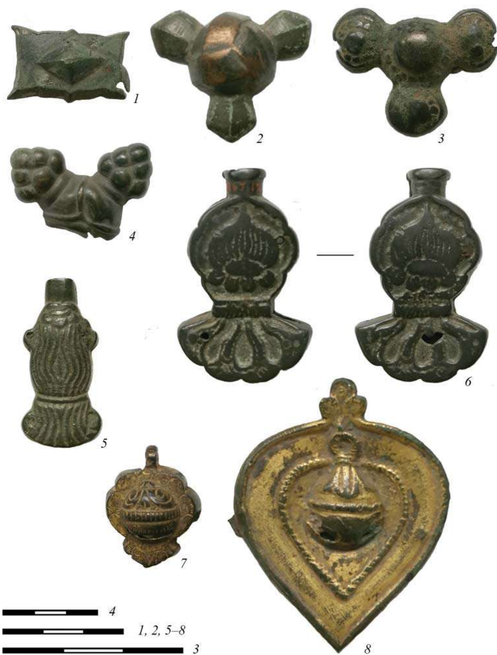
Рис. 1. Геометрический декор предметов из коллекции И.П. Товостина (1–5, 7, 8) и покупки А.М. Тальгрена (6)

Fig. 1. Geometric décor of items from the collection of I.P. Tovostin (1–5, 7, 8) and the purchase of A.M. Tallgren (6)