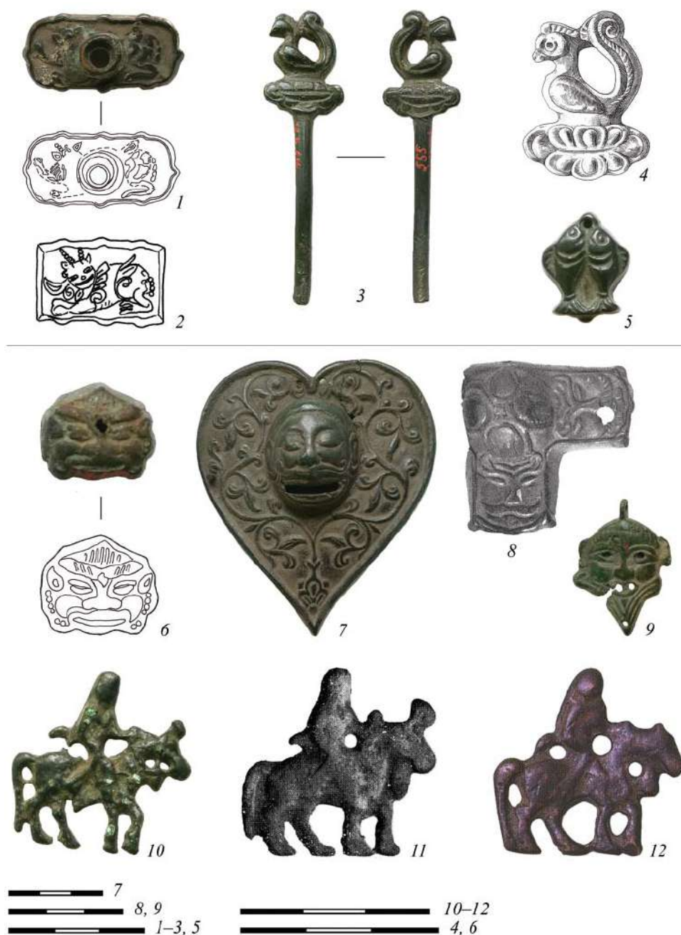
Рис. 5. Зооморфный (1, 3, 5) и антропоморфный (6–10) декор и аналогии (2, 4, 11, 12). 11 – Ходжент, Средняя Азия (по: Зеймаль 1985, 327, кат. 836); 12 – Ордос (по: John 2006, 126, fig. 286) Fig. 5. Zoomorphic (1, 3, 5) and anthropomorphic (6–10) décor and analogies (2, 4, 11, 12). 11 – Khujand, Central Asia (after Zeimal 1985, 327, cat. 836); 12 – Ordos (after John 2006, 126, fig. 286)