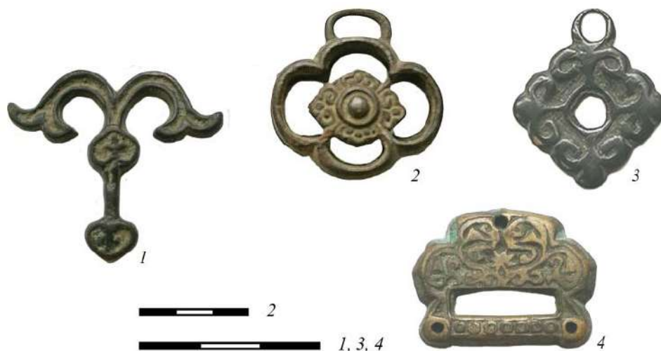
Рис. 4. Предметы неясной датировки с растительным декором (1–4) Fig. 4. Objects of obscure dating with floral décor (1–4)

овальными точками, напоминающие рога диких козлов. Сбоку головы – возможно, грива. Задние лапы у таких животных обычно изображены так, что напоминают мощные птички, и это делает образ близким к льву-грифону, но без птичьей головы и с рогами (рис. 5, 2) 68 .