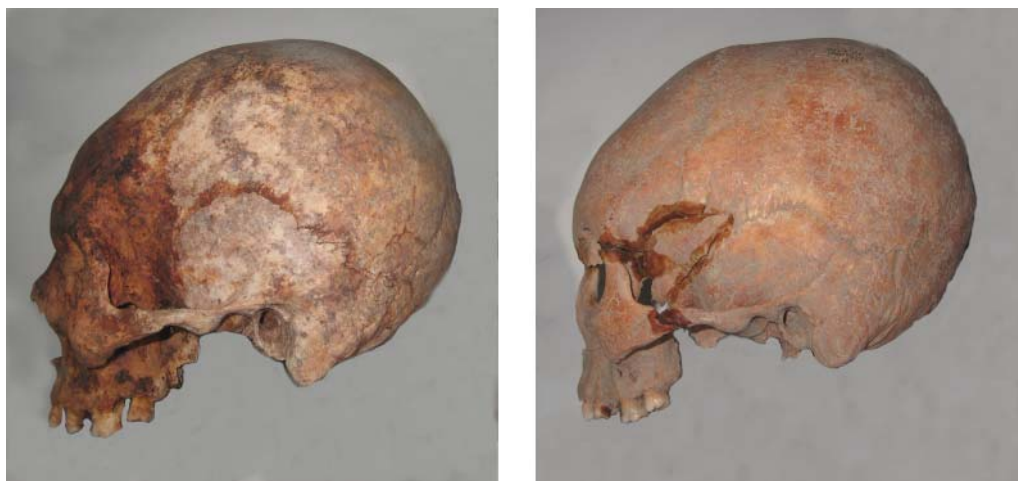
Рис. 2. Искусственно деформированные черепа из некрополя при с. Мангуш: А – № 11 ♀ 25–30 лет, Б – № 3 ♀ 45–50 лет.