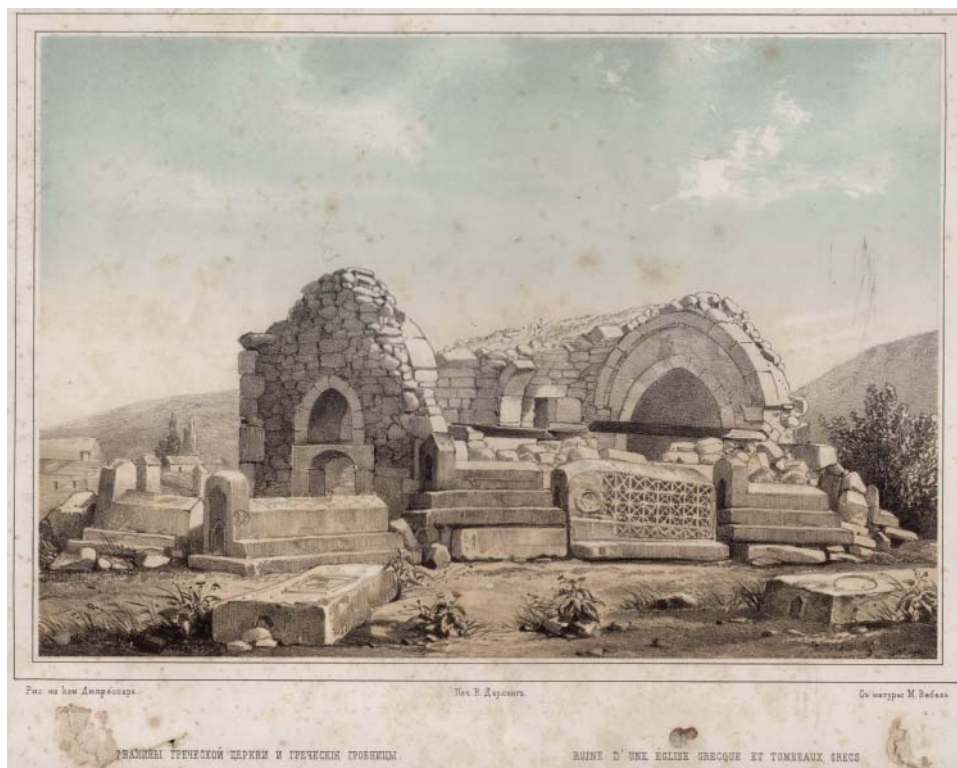
Рис. 1 Греческое кладбище и церковь Св. Федора в с. Мангуш. Литография по рисунку М.Б. Вебеля, 1853.