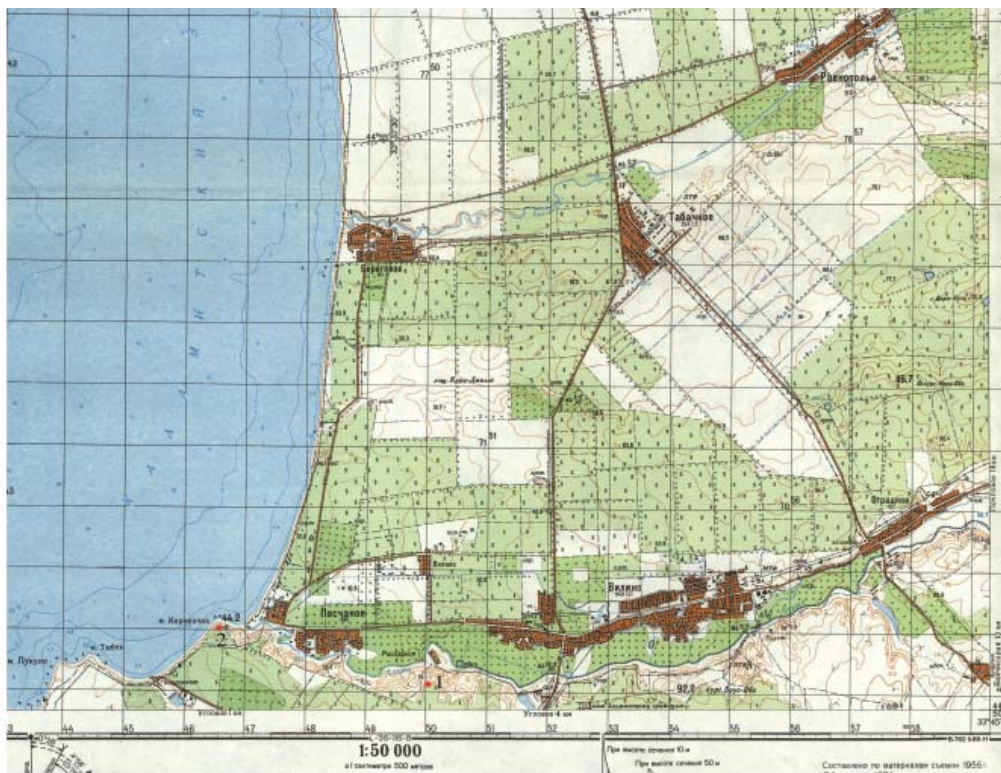
1 - поселение Вилино (Рассадное). 2 - Усть-Альминское городище.