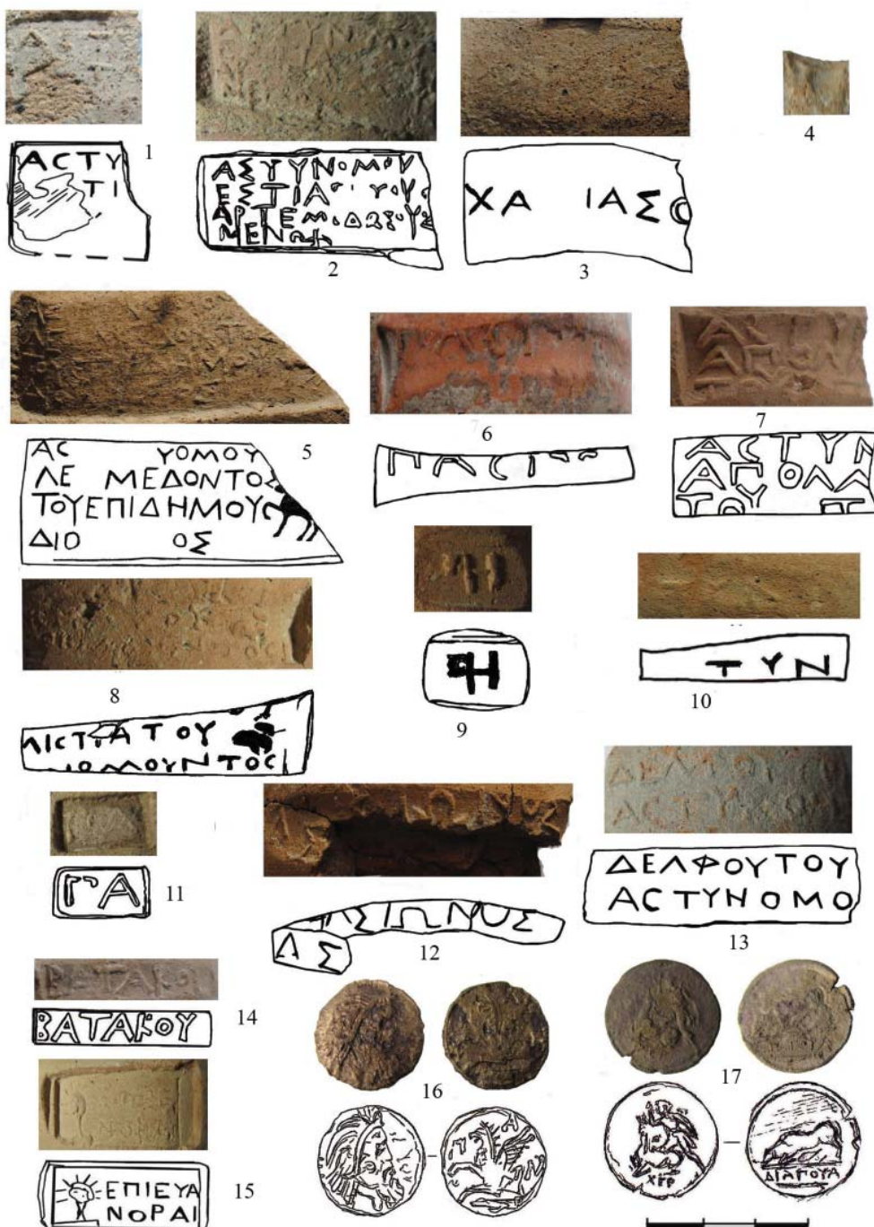
Ρις. 3. Κεραμικες κλειμα: 1-5 - Σινοπα; 6-14 - Χερσονες; 15 - Ροδος. Μόνετα: 16 - Παντικαπει; 17 - Χερσονες Fig. 3. Ceramic stamps: Sinope (1-5); Chersoneses (6-14); Rhodes (15). , Coins: Panticaepum (16); Chersoneses (17)