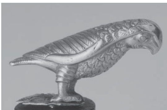
Рис. 3. Золотая статуэтка орла. V–III вв. до н.э. Государственный Эрмитаж (инв. № Z-558)

небольшую золотую фигурку, предположительно ахеменидского или раннеэллинистического времени (рис. 3).