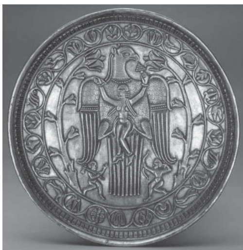
Рис. 11. Серебряное блюдо с изображением птицы, несущей обнаженную девушку. Государственный Эрмитаж (инв. № S-217)