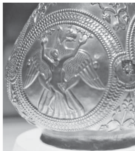
Рис. 12. Золотой сосуд из клада в Надь-Сент-Миклош с изображением птицы, несущей обнаженную девушку. Венский художественно-исторический музей

При династии Сасанидов (III–VII вв.) многочисленные орлы появляются на сасанидских печатях, на предметах торевтики. Встречаются и скульптурные изображения 17 . В это время хищная птица – не только воплощение божества Веретрагны. Изображение на одном из эрмитажных блюд (инв. № S-217) представляет эту птицу как проводника души в загробный мир, в небесный Парадиз (рис. 11). Птица несет в когтях обнаженную девушку – человеческую душу ( руван ). Девушка подкармливает птицу ягодами – благими делами, совершенными при жизни. Это аллегорическое изображение путешествия души праведника в рай, призыв совершать благие дела, облегчающие этот путь. Аналогичный сюжет представлен и на нескольких золотых сосудах из клада, обнаруженного в 1799 году близ венгерского селения Надь-Сент-Миклош (недалеко от города Сегедин), который сейчас находится в Венском художественно-историческом музее (рис. 12). При том, что сама сцена перемещения души в рай вполне укладывается в зороастрийскую концепцию справедливого посмертного воздаяния за все совершенное в этой жизни, какие-либо тексты с описанием перемещения души посредством гигантской птицы нам до сих пор не известны.