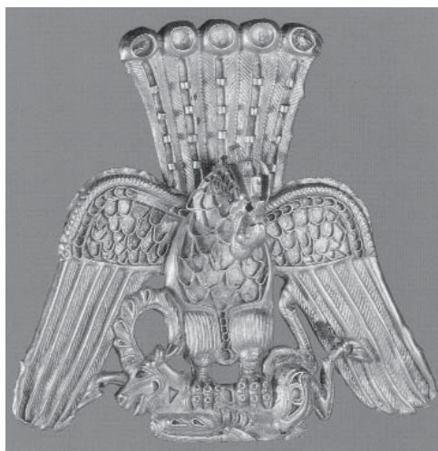
Рис. 2. Ахеменидская золотая подвеска со стилизованным изображением орла, терзающего козла. VI–IV вв. до н.э. Государственный Эрмитаж

начиная со второй половины I в. до н.э., имеется изображение орла, несущего диадему, за головой царя. Весьма вероятно, что в образе орла очень часто выступает сама богиня Ника. Можно предположить, что образ орла сам по себе был связан с положениями официальной царской идеологии.