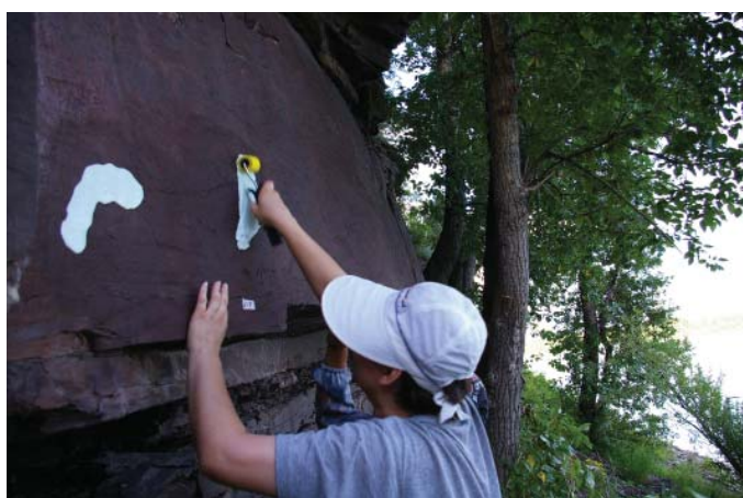
Рис. 2–4. Е.Г. Дэвлет на Шалоболинской писанице, 2009 г.