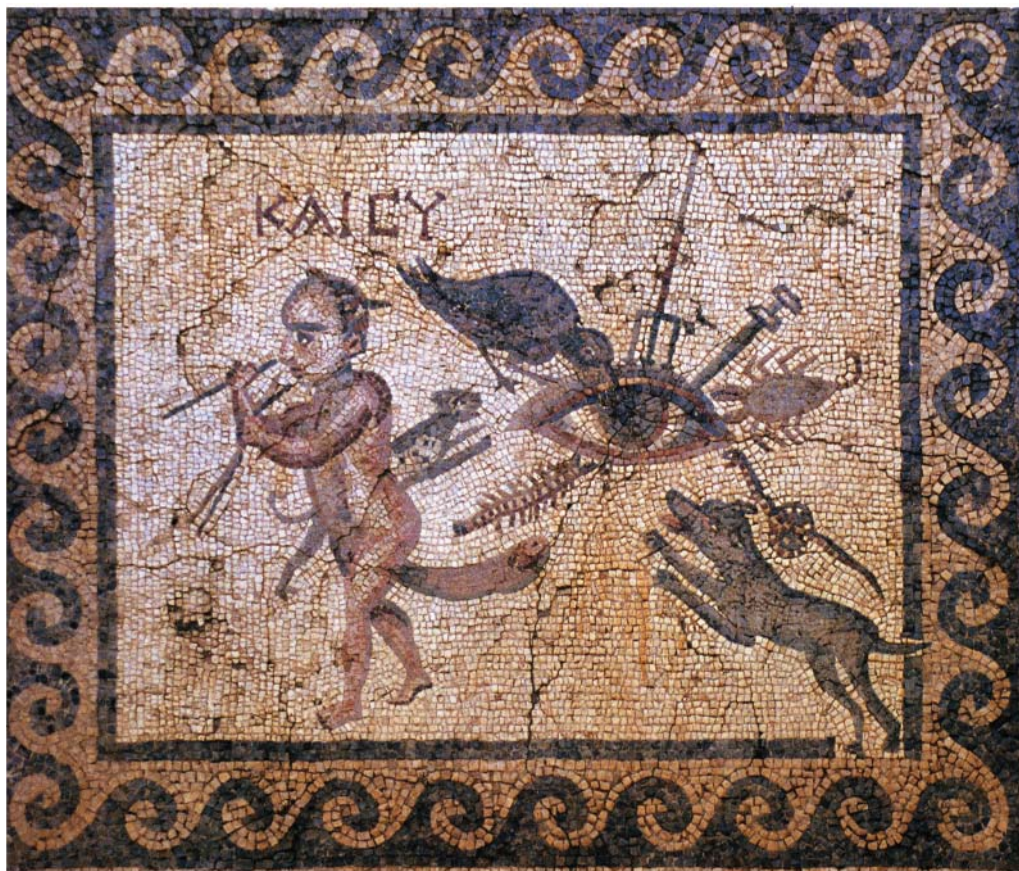
Рис. 4. Напольная мозаика из «Дома дурного глаза». Инв. № 1024.

Египетское влияние на греческую культуру прослеживается еще до эллинизма, с приходом к власти династии Птолемеев, египетские культы окончательно проникают в античную мифологию и приобретают популярность на территории полисов Северного Причерноморья 21 .