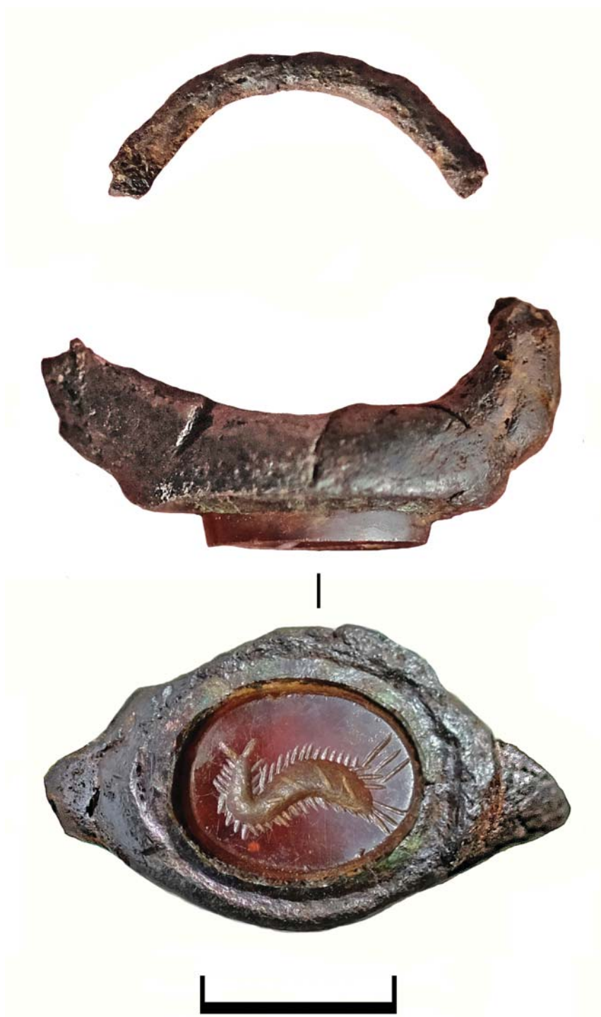
Рис. 3. Грунтовый некрополь Ростовского городища. Погребение 79: 1 – железный перстень с геммой.