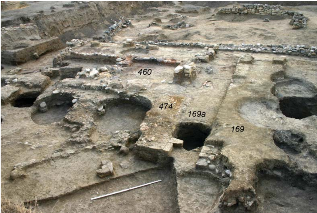
Рис. 1. Центральная часть Западного участка раскопа «Верхний город», общий вид с З-ЮЗ (2011 г.)