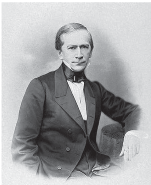
Рис. 1. Корф в молодости

секретарем империи (1834–1843). Но у него, по отзывам современников, была и неосуществленная мечта: он очень хотел стать министром. Об этом свидетельствуют как современники, среди которых А.В. Никитенко и А.Н. Веселовский, так и сам барон. Светская молва прочила Корфа в министры юстиции (в 1839 г.), народного просвещения (в 1849 г.), а государь император Александр II предложил ему возглавить министерство цензуры (в 1859 г.), но до учреждения сего ведомства дело так и не дошло. В памяти потомков Корф остался в первую очередь директором Публичной библиотеки (ныне – Российской национальной библиотеки), которую он превратил в одну из лучших библиотек Европы и неисчерпаемый источник и хранилище сведений о России, благодаря собираемой по его почину коллекции книг «Россика». Директорствовал Корф с 1849 по 1861 г. 2