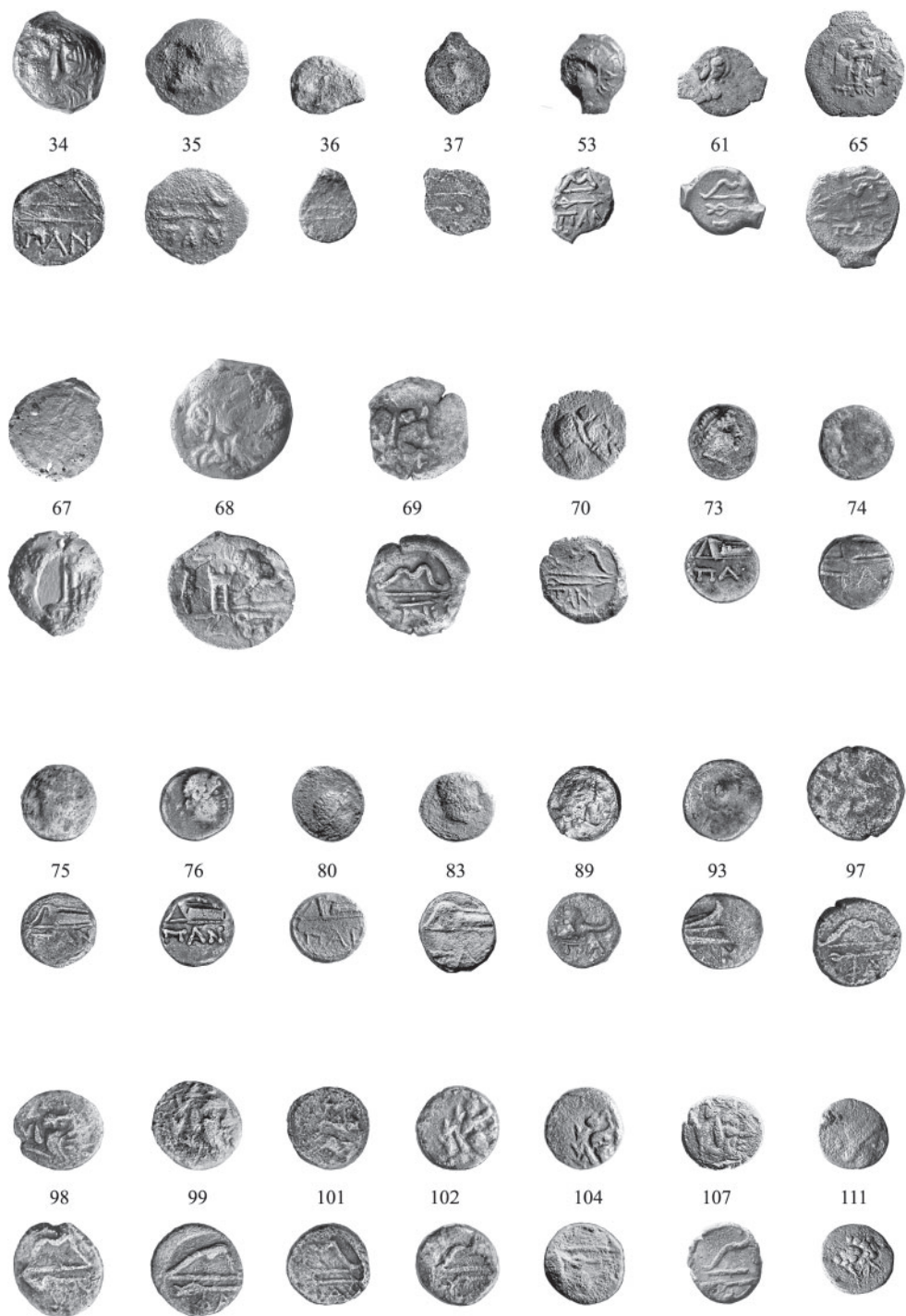
Рис. 4. Монеты из раскопок поселения у ст. Старотитаровская, 0,6 км Fig. 4. Excavation coins from the settlement near Starotitarovskaya, 0,6 km