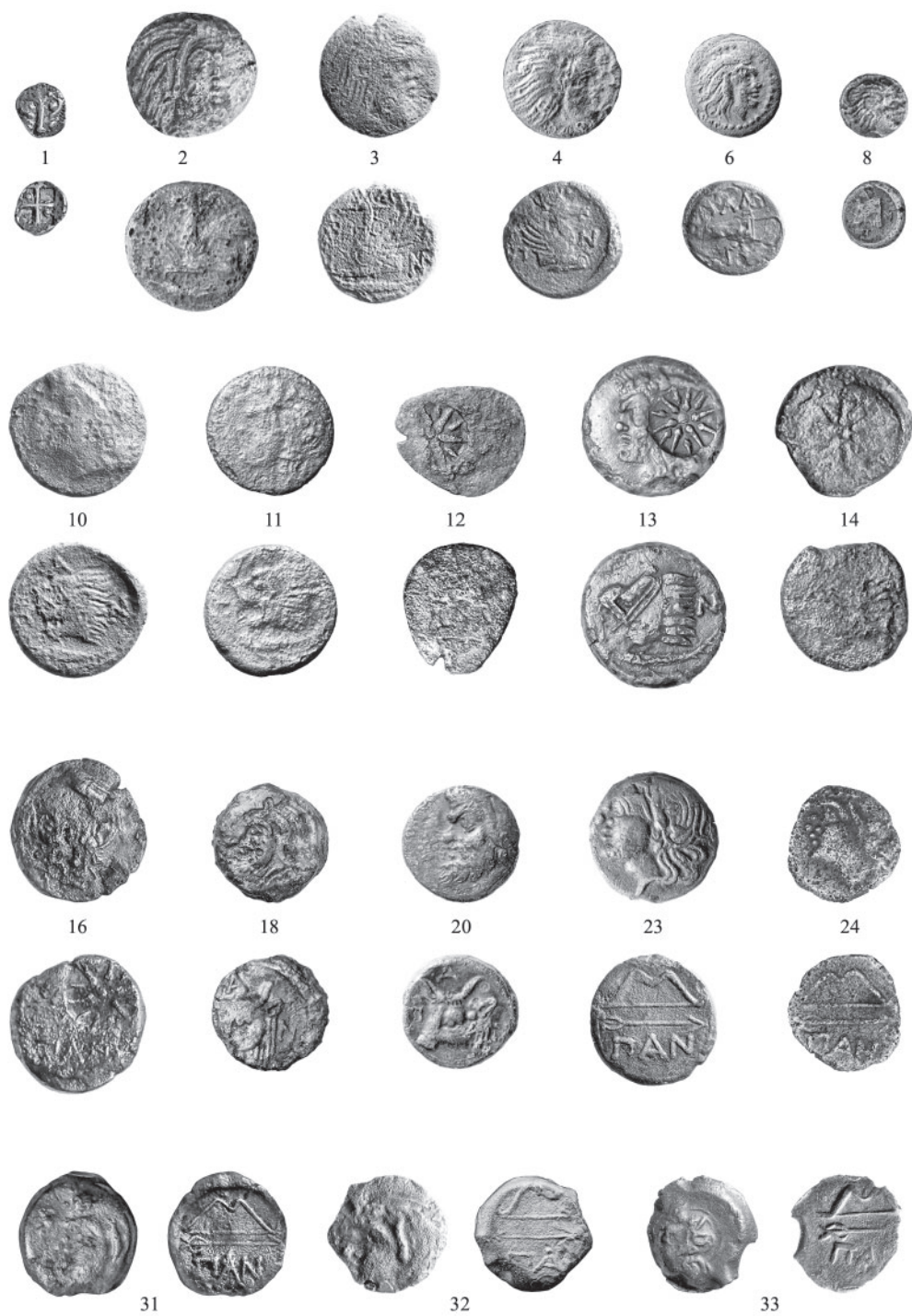
Рис. 3. Монеты из раскопок поселения у ст. Старотитаровская, 0,6 км Fig. 3. Excavation coins from the settlement near Starotitarovskaya, 0,6 km