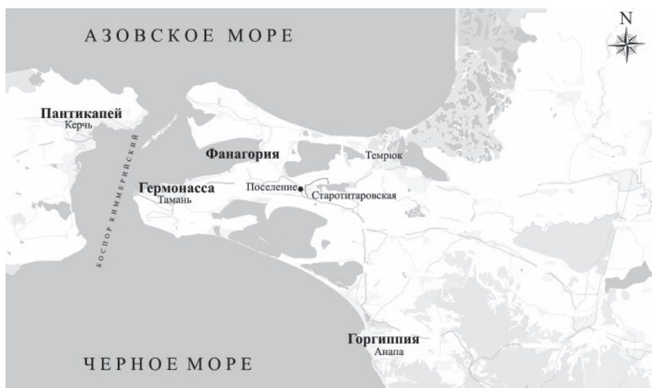
Рис. 1. Местоположение поселения у ст. Старотитаровская, 0,6 км Fig. 1. Location of the site of Chekups-2