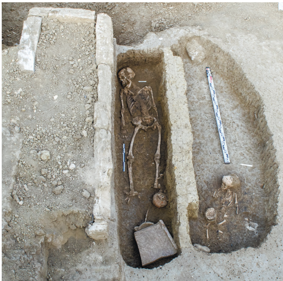
Рис. 9. Фанагория. Погребения 2019/320 и 2021/321. Fig. 9. Phanagoria. Burials 2019/320 and 2021/321.

Иногда удается определенно интерпретировать эти захоронения как подкурганые, в некоторых случаях, планиграфическая ситуация, подкрепленная стратиграфическими наблюдениями, позволяет говорить о регулярном расположении этих гробниц в пространстве некрополя.