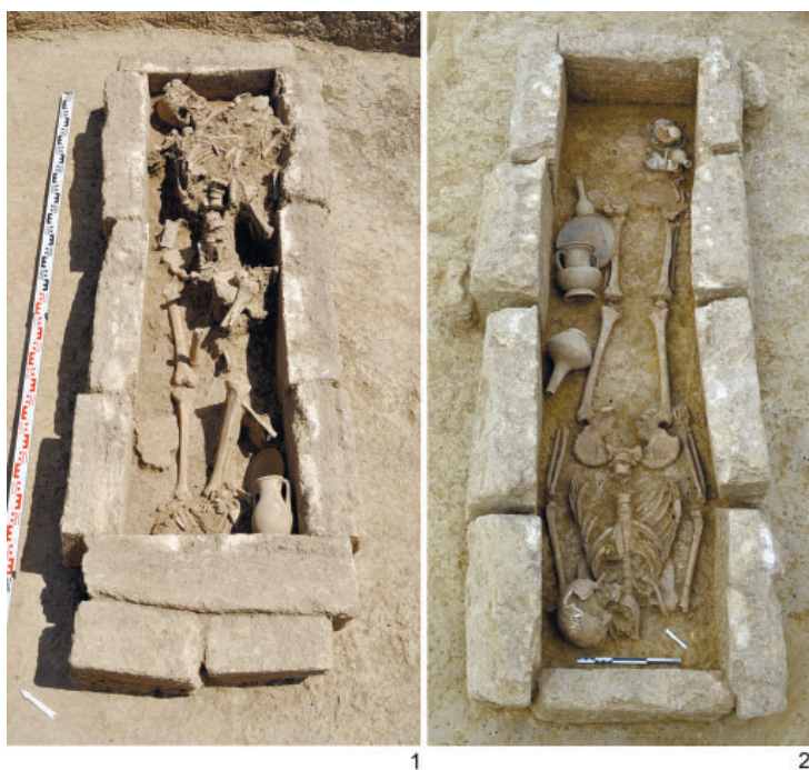
Рис. 1. Каменные ящики Фанагории: 1 – погребение 2013/190; 2 – погребение 2016/275. Fig. 1. Stone boxes of Phanagoria: 1 – burial 2013/190; 2 – burial 2016/275.