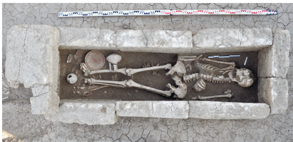
Рис. 4. Фанагория. Погребение 2014/222. Fig. 4. Phanagoria. Burial 2014/222.