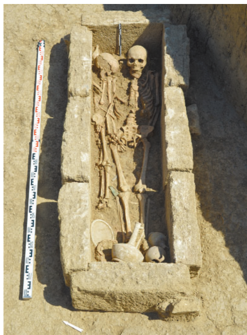
Рис. 5. Фанагория. Погребение 2014/228. Fig. 5. Phanagoria. Burial 2014/228.