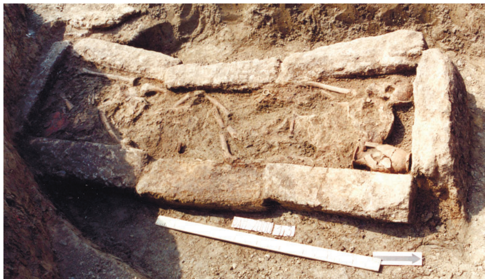
Рис. 3. Фанагория. Погребение 2000/13. Fig. 3. Phanagoria. Burial 2000/13.