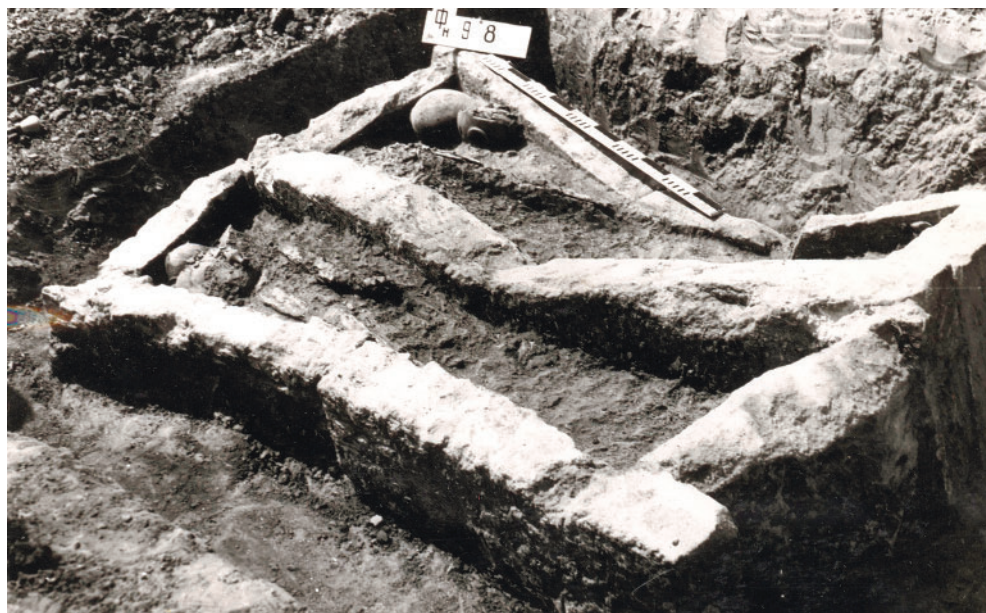
Рис. 7. Фанагория. Погребение 1964/западный некрополь. Fig. 7. Phanagoria. Burial 1964/Western necropolis.