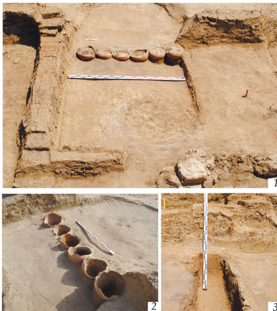
Рис. 1. Дом № 888, помещение 2: 1, 2 – амфоры в СВ углу, виды с запада и ЮЗ; 3 – северная часть траншеи, в которой были установлены амфоры Fig. 1. House No. 888, Room 2: 1, 2 – amphorae in the NE corner, views from W and SW; 3 – the northern part of the trench in which the amphorae were installed