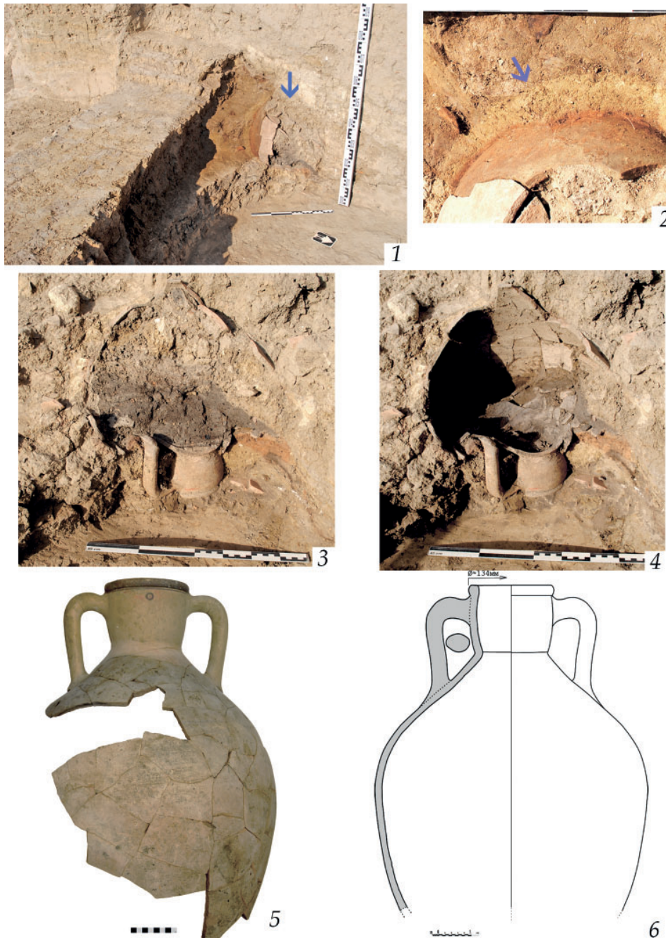
Рис. 4. Амфора-печка в помещении 3: 1 – общий вид с СВ; 2 – глиняная обмазка стенок (деталь); 3, 4 – вид с С-СВ до и после удаления заполнения; 5 – фото; 6 – прорисовка Fig. 4. Amphora-stove in Room 3: 1 – general view from NE; 2 – clay coating of the walls (detail); 3, 4 – view from N-NE before and after removal of filling; 5a, b – photo of the neck of the amphora (side and top views)