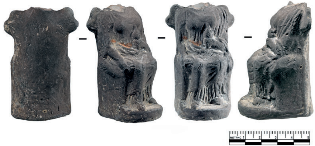
Рис. 2. Терракотовая статуэтка Афины Эрганы. Из раскопок Пантикапея. ВКИКМЗ.