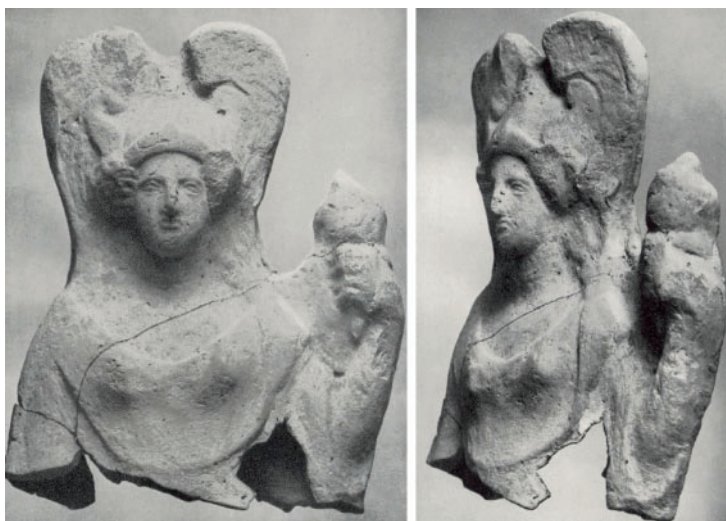
Рис. 3. Терракотовая статуэтка Афины из Скорнаваке, Рагуза, Сицилия (по: Di Vita 1952–1954, 144–145, Fig. 2, 3)