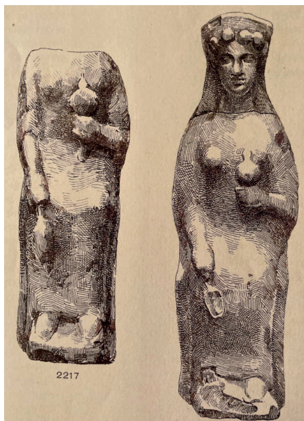
Рис. 4. Терракотовые статуэтки из святилища Афины Линдии на Родосе (по: Blinkenberg 1931, pl. 102, no. 2217)