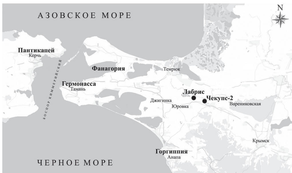
Рис. 1. Местоположение поселения Чекупс-2 Fig. 1. Location of the site of Chekups-2