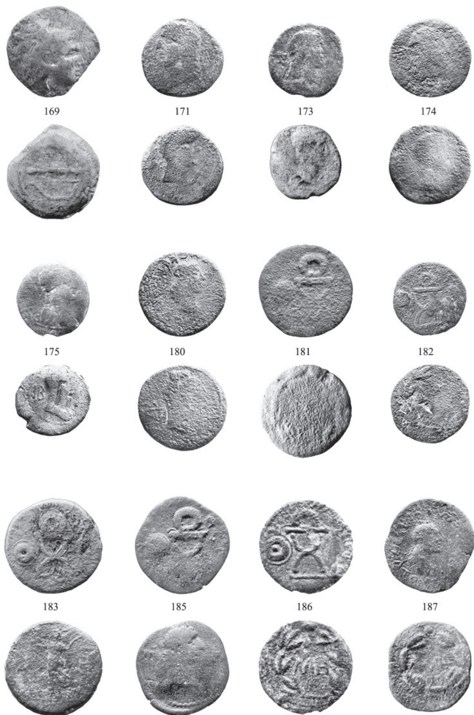
Рис. 5. Монеты из раскопок поселения Чекупс 2 Fig. 5. Excavation coins from the settlement of Chekups-2