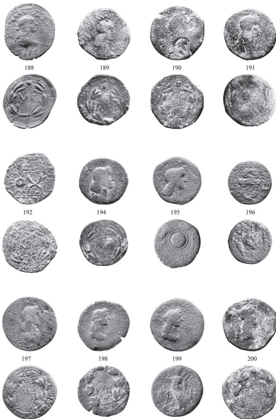
Рис. 6. Монеты из раскопок поселения Чекупс 2 Fig. 6. Excavation coins from the settlement of Chekups-2