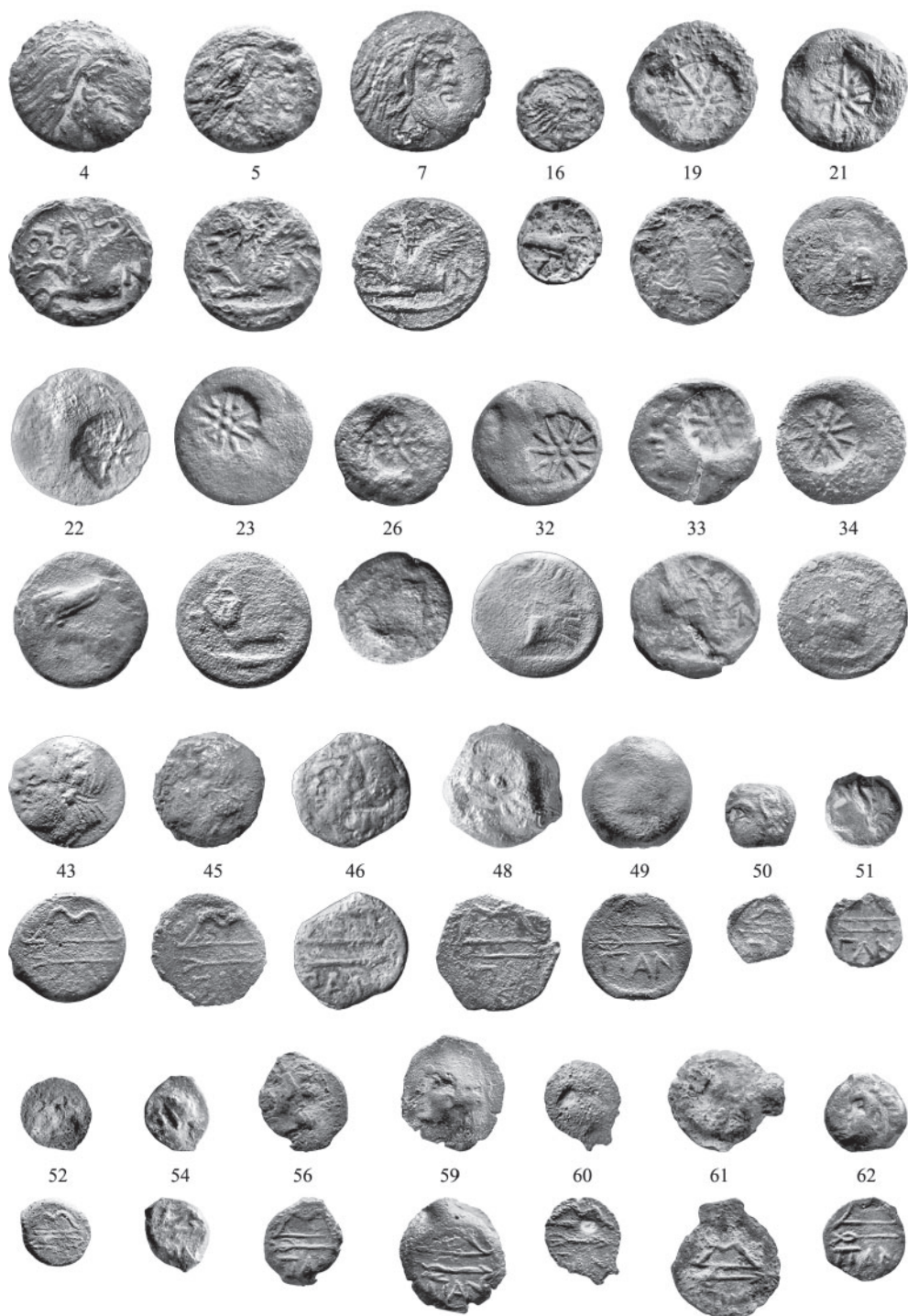
Рис. 3. Монеты из раскопок поселения Чекупс 2 Fig. 3. Excavation coins from the settlement of Chekups-2