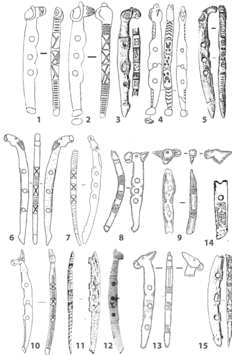
Рис. 2. «Киммерийская розетка» в структуре изображений восточноевропейского скифского звериного стиля: образы барана (1–5) и лошади (6–15). 1, 2 – Волковцы, курган 3, раскопки И.А. Линниченко (по: Ильинская 1968, рис. 25, 7, 9); 3, 15 – Аксютинцы, курган 470 (по: Галанина 1977, табл. 20, 3; Могилев 2008, рис. 54, 13); 4 – с. Райгород, курган 1 (по: Могилев 2008, рис. 43, 13); 5 – Поповка, курган 18 (по: Могилев 2008, рис. 41, 13); 6 – Роменский уезд (по: Могилев 2008, рис. 45, 1); 7 – с. Волковцы, к. 1 или с. Будки, курган не идентифицирован (по: Могилев 2008, рис. 46, 3); 8–10, 13 – Шумейковский курган (по: Могилев 2008, рис. 46, 8, 9, 11, 11а, 3, 3а, 4, 12, 12а); 11 – Басовка, к. Б (по: Галанина 1977, табл. 27, 5); 12 – Аксютинцы, Стайкин Верх, к. 4 (по: Самоквасов 1908, № 1567, 1568); 14 – Севериновка (по: Могилев 2008, рис. 54, 8)

Fig. 2. “Cimmerian rosette” in the structure of images of the Eastern European Scythian animal style