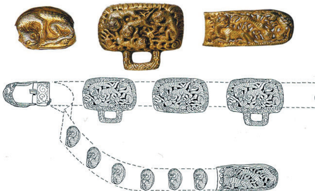
Рис. 3. Поясные накладки и реконструкция пояса из могильника «Олень-Колодезь» (по: Крамаровский 2000)