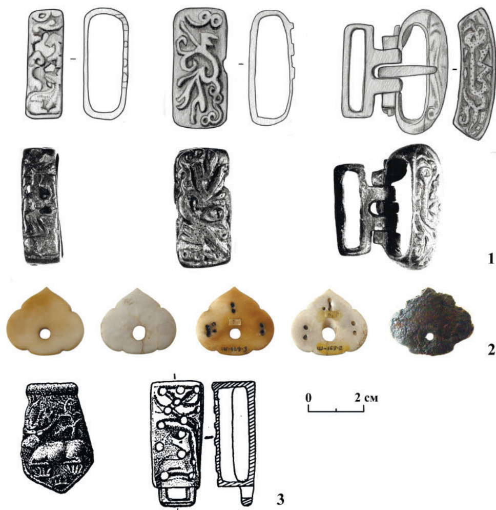
Рис. 2. Детали поясных наборов. 1, 2 – Шайгинское городище (жилища 174, 169); 3 – Аняньевское городище (жилище 27)

Fig. 2. Details of belt sets. 1, 2 – Shayginskoye fortified settlement (dwellings 174, 169); 3 – Ananyevskoye fortified settlement (dwelling 27)