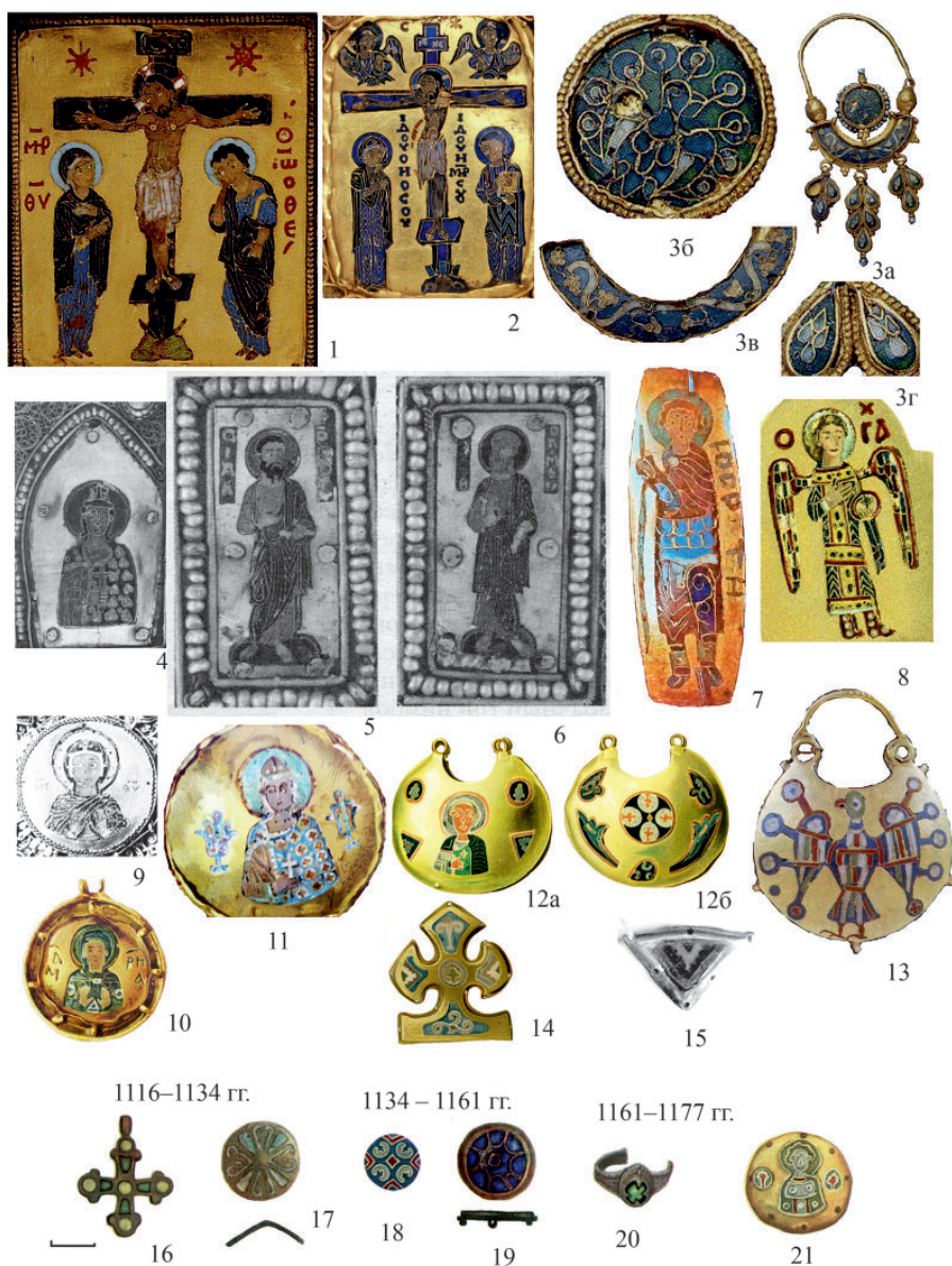
Рис. 7. Перегородчатая эмаль. Византия: 1 – конец X – начало XI в.; 2 – Старая Рязань 1822, XI в. (по: Стерлигова 2013, № 20); 3 – вторая половина X в. (по: Evans, Wichom 1997, № 110, 228); Русь: 4–6 – оклад Мстиславова Евангелия (по: Жилина, Макарова 2008, табл. 20, 6, 7, 3; 19); 7 – «Св. Георгий», Новгород, начало XII в. (по: Лифшиц 2021, рис. 1); 8 – Киев 1889; 9–11 – Старая Рязань 1822; 12 – Владимир 1865; 13 – Княжа Гора 1896; 14, 15 – Старая Рязань 1868 (по: Жилина 2014, № 99/3; 162/1, 2, 4, 5; 167/1; 120/2; 163/9, 10); Новгород: 16–17 – 1116–1134 гг.; 18–1134–1177 гг.; 19 – 1134–1161 гг.; 20 – 1161–1177 гг.; 21 – первая половина XII в. – ? (по: Седова 1981, рис. 80, 1, 2, 9, 17, 20, 21). Дата после названия места находки означает год находки Fig. 7. Cloisonné enamel