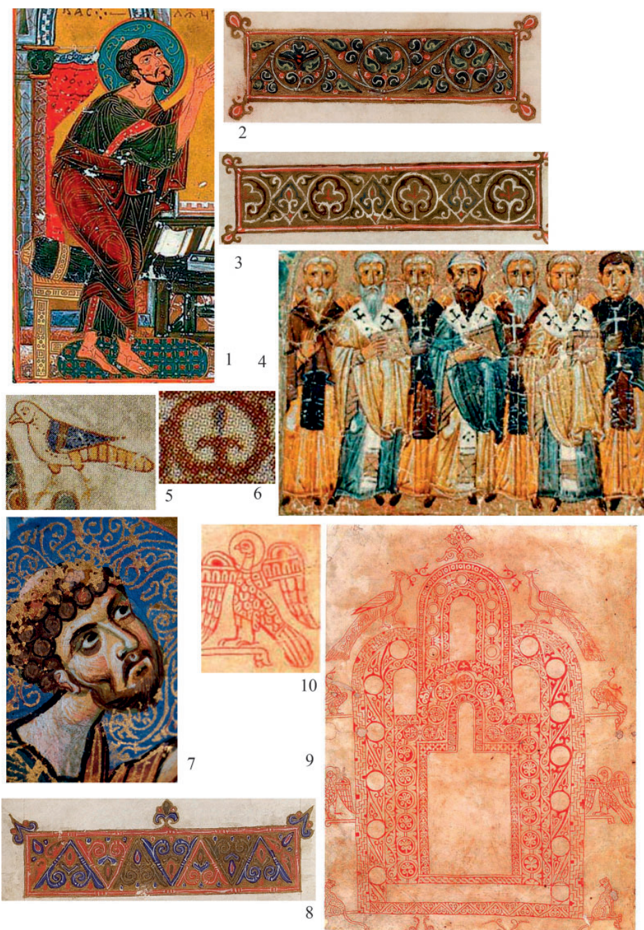
Рис. 3. Миниатюра, аскетическое направление. 1–3 – Остромирово Евангелие, 1056, 1057 гг.; 4–6 – Изборник Святослава, Киев, 1073 г.; 7, 8 – Мстиславово Евангелие, 1103–1117 гг.; 9, 10 – Юрьевское Евангелие, 1119–1128 гг. (по: Сарабьянов, Смирнова 2007, ил. 59, 74, 104, 105; Орлова 2007б, ил. 518, 521, 523, 524, 570)