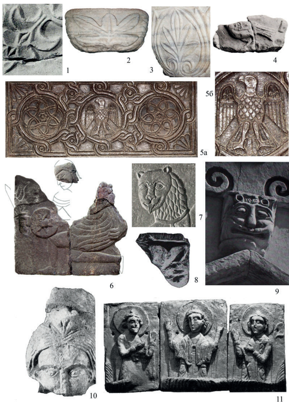
Рис. 5. Каменная резьба. 1 – саркофаг, Десятинная церковь, Киев, конец X в.; 2 – епископский двор, Переяславль Русский, XI в.; 3–5 – Софийский собор, Киев, вторая половина XI – начало XII в.; 6 – церковь на Владимирской ул.; 7 – Киево-Печерский монастырь (по: Архипова 2007, ил. 652, 604, 607, 623, 641, 644); 8–10 – собор Рождества Богородицы, Боголюбово, конец 1150х – начало 1160-х гг.; 11 – Успенский собор, Владимир, 1150–1160-е гг. (по: Вагнер 1969, ил. 51, 35, 44, 61)