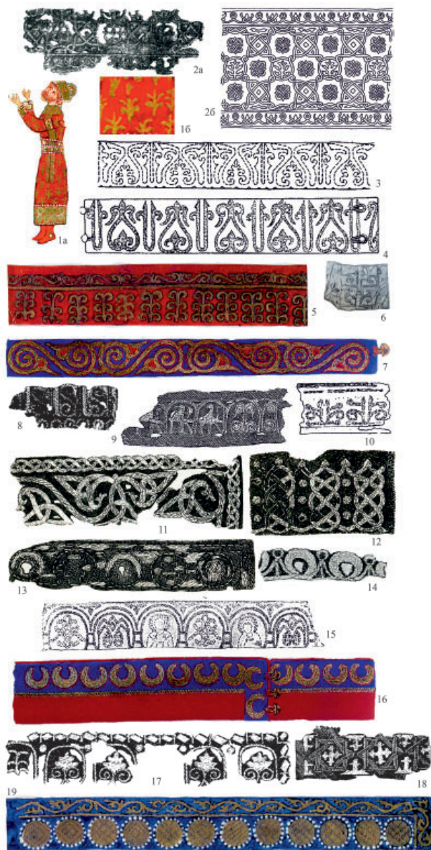
Рис. 11. Золотая вышивка. 1 – князь Ярополк, миниатюра Трирской Псалтыри, первая половина XI в. (по: Кондаков 1906, табл. VI); 2 – Херсонес (по: Новицкая 1967, рис. 2; 1972, табл. IX); 3, 4 – Новгород, гробница Владимира Ярославича, первая половина XI в. (по: Сабурова 1997, табл. 67, 2, 3); 5, 7, 10, 16, 19 – Суздальский некрополь, X – XI в. (по: Сабурова 2012, рис. 2цв., 2, 3; 1цв., 3, 1; 2, 6); 6 – Шарки (Шаргород) (по: Новицкая 1965, табл. II, 4); 8 – Болдина Гора, XI в.; 9 – Кургино 2; 11, 15, 18 – Караш; 12 – Васильки; XI–XII вв.: 13 – Кубаево; 14 – Осиповцы; 17 – Шелебово, XI в. (по: Фехнер 1993, рис. 1, 2, 1; 2, 4, 1, 3, 5; 1985, 223, рис. 2; Спицын 1905, рис. 257) Fig. 11. Golden Embroidery