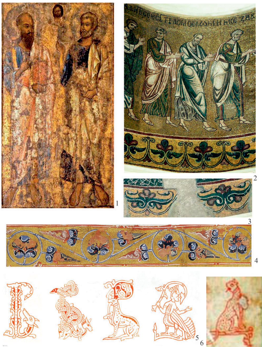
Рис. 4. Тенденции классицизма в живописи и миниатюре. 1 – икона «Апостолы Петр и Павел», Новгород, Софийский собор, середина XI в.; 2, 3 – мозаики, Михайловский Златоверхий собор, Киев, 1112 г. (по: Сарабьянов, Смирнова 2007, ил. 56, 65, 62); 4 – Мстиславово Евангелие, 1113–1117 гг.; 5, 6 – Юрьевское Евангелие, 1119–1128 гг. (по: Орлова 2007б, ил. 565, 588, 589)