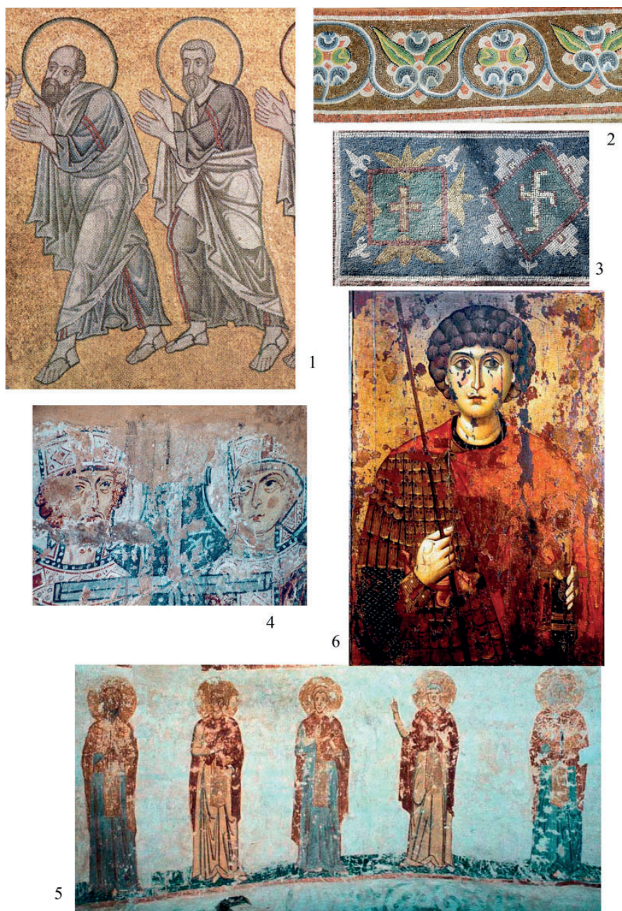
Рис. 2. Монументальное искусство Древней Руси. 1–3 – мозаика, Софийский собор, Киев, после 1036 г. (по: Колпакова 2005, 333; Орлова 2007а, ил. 296, 322); 4 – фреска, Софийский собор, Новгород, вторая половина XI в.; 5 – фреска, Георгиевский собор Юрьева монастыря, около 1130 г.; 6 – икона «Святой Георгий», Успенский собор Московского Кремля, около середины XI в. (по: Сарабьянов, Смирнова 2007, ил. 81, 98, 57) Fig. 2. Monumental art of Medieval Rus'