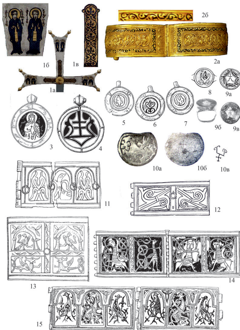
Рис. 8. Чернь. Византия: 1 – середина XI в. (по: Evans, Wixom 1997, no. 24); 2 – X–XI вв. (по: Papanikola-Bakirtzi 2002, no. 519); Русь: 3, 4 – Старая Рязань 1970; 5–7 – Киев 1901; 8 – Шмарово 1849; 9 – Старая Рязань 1979 № 2 (по: Жилина 2014, № 186/2a1, 2б; 85/1, 4; 155/2; 189/3); 10 – матрица для колта, 1030–1093 гг. (по: Робаков 1969, 253, рис. 82, 83, 85); 11, 12 – Любеч 1907, 1960; 13 – Терехово 1876; 14 – Киев 1903; 15 – Киев 1893 (по: Макарова 1986, № 237, рис. 40, Жилина 2014, № 203/3; 154/6; 103/13, 94/2). Дата после названия места находки означает год находки