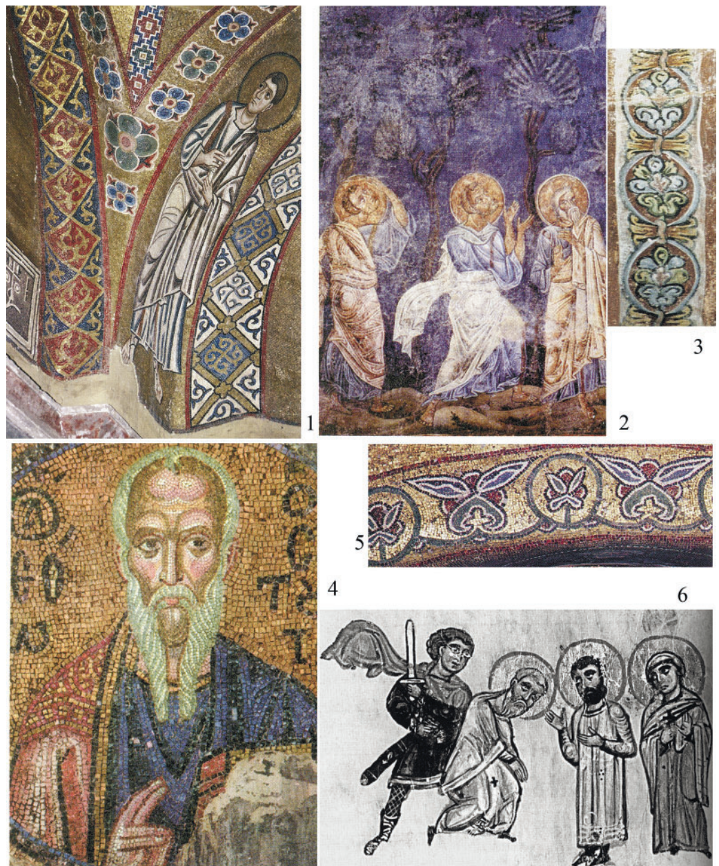
Рис. 1. Монументальное искусство Византии. 1 – мозаика, монастырь Осиос Лукас, Фокида, после 1012 г. / 1030–1040 гг.; 2, 3 – фрески, собор Св. Софии Охридской, около 1056 г.; 4, 5 – мозаика, монастырь Неа Мони на Хиосе, середина XI в. (по: Колпакова, 2005, 342, 338; Орлова 2007а, ил. 305, 309, 307); 6 – миниатюра, Менологий, середина XI в. (по: Попова 2006, ил. 118)