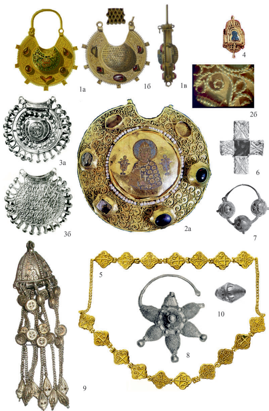
Рис. 9. Филигрань, первая половина – середина XII в.: 1 – собрание И.П. Балашова (по: Кондаков 1896, табл. XIV); Старая Рязань: 2–4 – 1822, 1992 (по: Вагнер 1971, ил. 3; Жилина 2014, № 162/4, 7; 191/3); 5 – 1868; 6–8 – 1970; 9 – 2005; 10 – 1937/1950 гг. (по: Жилина 2014, № 163/2; 186/9а, 7, 4; 192/5; 165/4а). Дата после внутреннего номера предмета означает год находки Fig. 9. Filigree, first half–middle of 12 th century