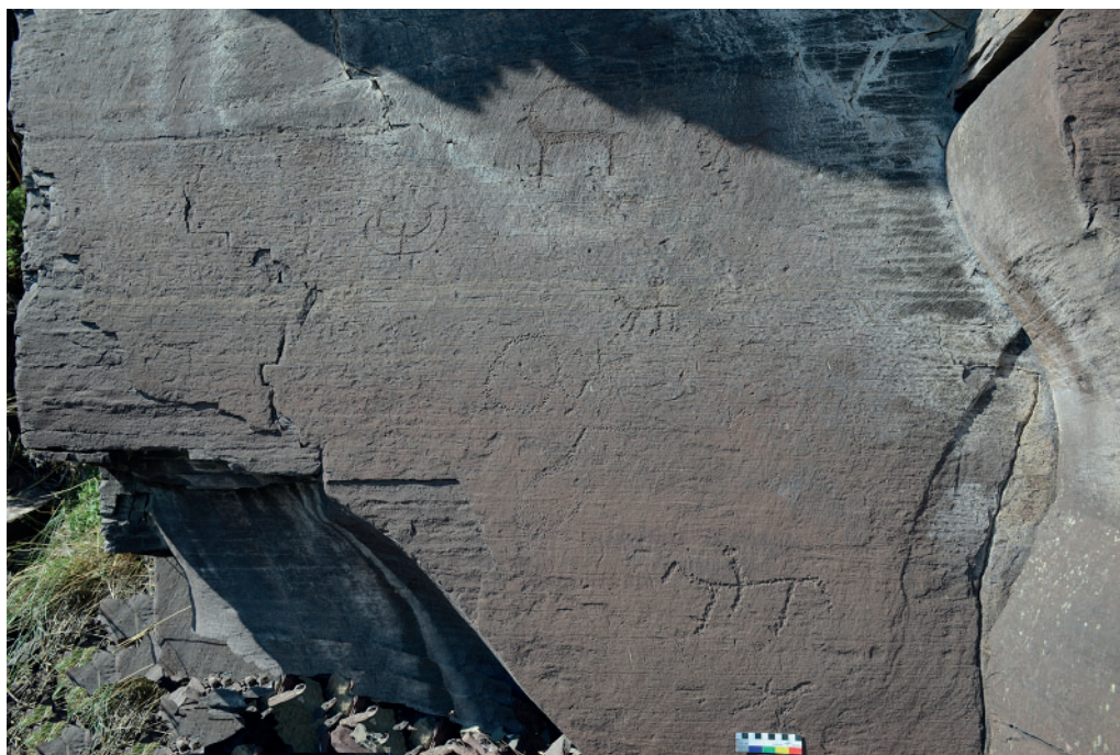
Рис. 5. Плоскость с изображением «птицы», обнаруженной в 2022 г. Лог Забочино

Fig. 5. Panel with the image of a “bird” discovered in 2022. Zabochino ravine