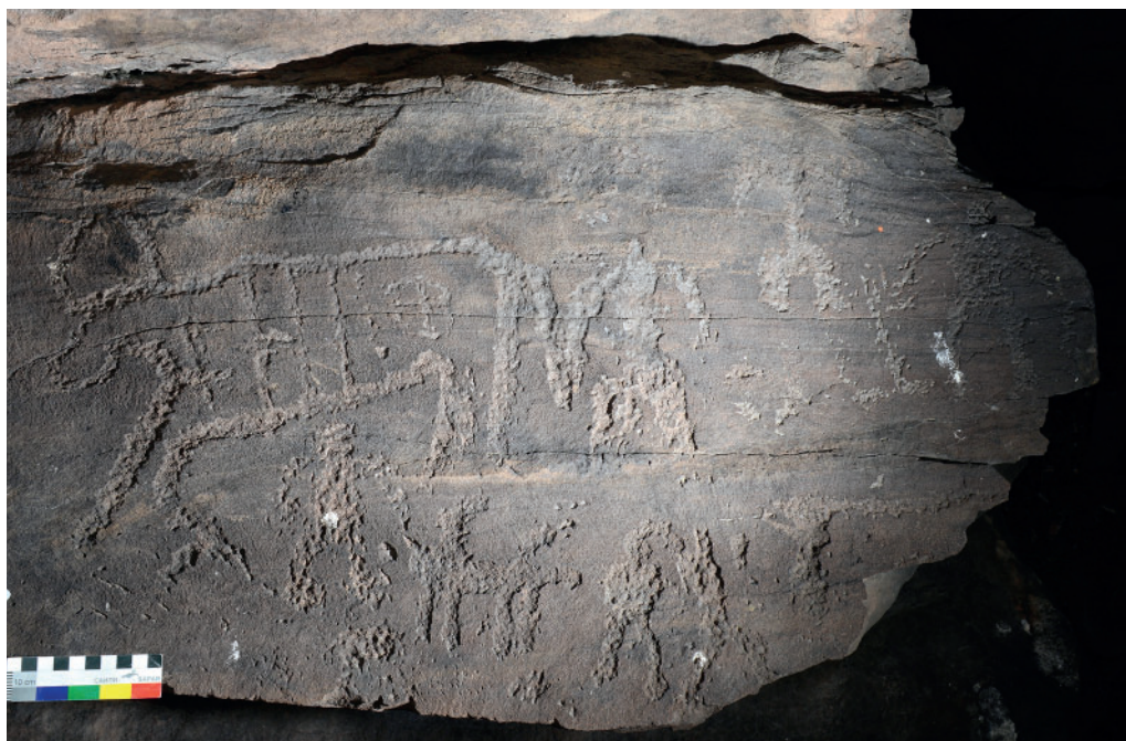
Рис. 1. Изображение быка с тамгой на крупе. Широкий лог. Fig. 1. The image of a bull with a tamga on the croup. Shirokiy ravine.

р. Енисей – ныне Красноярского водохранилища (Тепсей III, IV и недавно выявленный пункт Тепсей VI), режé тамги встречаются в Волчьем логу (Тепсей II). Неоднократно знаки выбиты на камнях тагарских курганов у подножия горы Тепсей 9 .