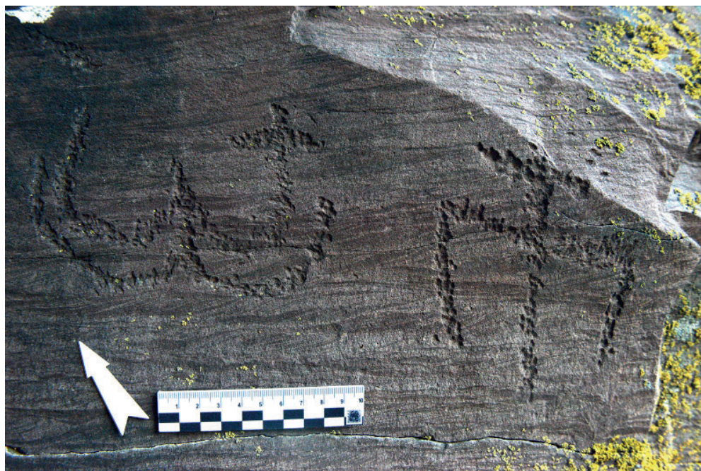
Рис. 3. Четырехдужная и М-образная тамги на одной плоскости. Тепсей VI