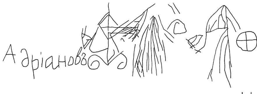
Рис. 5. Подпись Адрианова и рисунки шаманов на скалах горы Оглахты. Копия Е.А. Миклашевич (по: Дэвлет 2004, рис. 19)

Fig. 5. Adrianov's signature and drawings of shamans on the rocks of Mount Oglakhty. Copy by E.A. Miklashevich (after Devlet 2004, fig. 19)