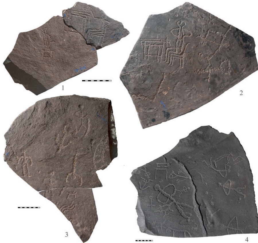
Рис. 4. Плиты со склонов горы Оглахты, переданные А.В. Адриановым в Красноярский краевой краеведческий музей в 1904 г. (коллекция № 4). Fig. 4. Slabs from the slopes of Mount Oglakhty handed over by A.V. Adrianov to Krasnoyarsk regional museum of local lore in 1904 (collection No. 4).

Оглахтинские плиты с описанными выше изображениями, наряду с другими, также переданными в Красноярский музей А.В. Адриановым в 1904 г. и сегодня хранятся в его фондах (рис. 4) и, вне всякого сомнения, заслуживают отдельной публикации.