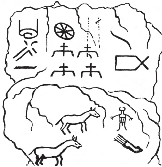
Рис. 1. Хакасская писаница на утесе Городовая Стена на правом берегу Енисея (по рисунку К. Шульмана от 18 февраля 1722 г.) (по: Кызласов, Леонтьев 1980, рис. 26) Fig. 1. Khakassian rock art site on the Gorodovaya Stena cliff on the right bank of the Yenisei (after the drawing by K. Shulman dated February 18, 1722) (after Kyzlasov, Leontyev 1980, fig. 26)

ласов и Н.В. Леонтьев предлагают именно с XVII в. вести отсчет традиции нанесения хакасами наскальных изображений, оговаривая, что она является продолжением той же графической манеры, которая была свойственна средневековому населению региона 7 .