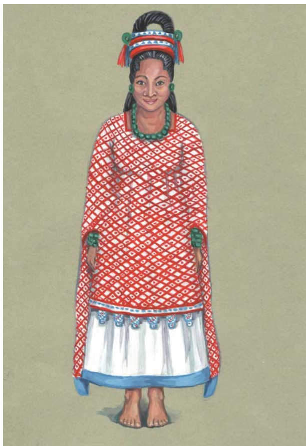
Рис. 1. Женщина майя в богатом наряде (Реконструкция автора 2021, художник Ж.Н. Пожарницкая).

Fig. 1. Mayan woman in rich costume (reconstruction I. Demicheva 2021, painter J. Pozharnitskaya).