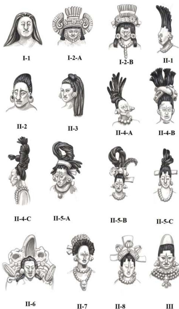
Рис. 3. Типы, подтипы и варианты подтипов мужских причесок на материале с о-ва Хайна (Реконструкция автора 2021, художник Ж.Н. Пожарницкая).