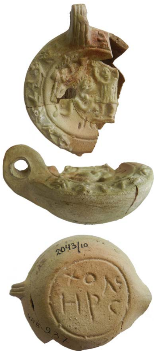
Рис. 1. Светильник из Херсонеса Таврического. ГИАМЗ «Херсонес Таврический». Fig. 1. Lamp from Tauric Chersonesos. State Museum-Preserve "Tauric Chersonesos".