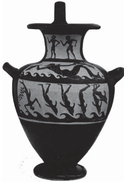
Рис. 7. Чернофигурная гидрия с изображением превращения тирренских пиратов в дельфинов. 510–500 гг. до н.э. Толлидо (Огайо), Музей искусств (по: CVA Toledo 1984, Fasc. 2, pl. 90).

Fig 7. Black-figure hydria depicting the transformation of Tyrrhenian pirates into dolphins, 510–500 BC. Toledo (Ohio) Museum of Art (after: CVA Toledo 1984, Fasc. 2, pl. 90).