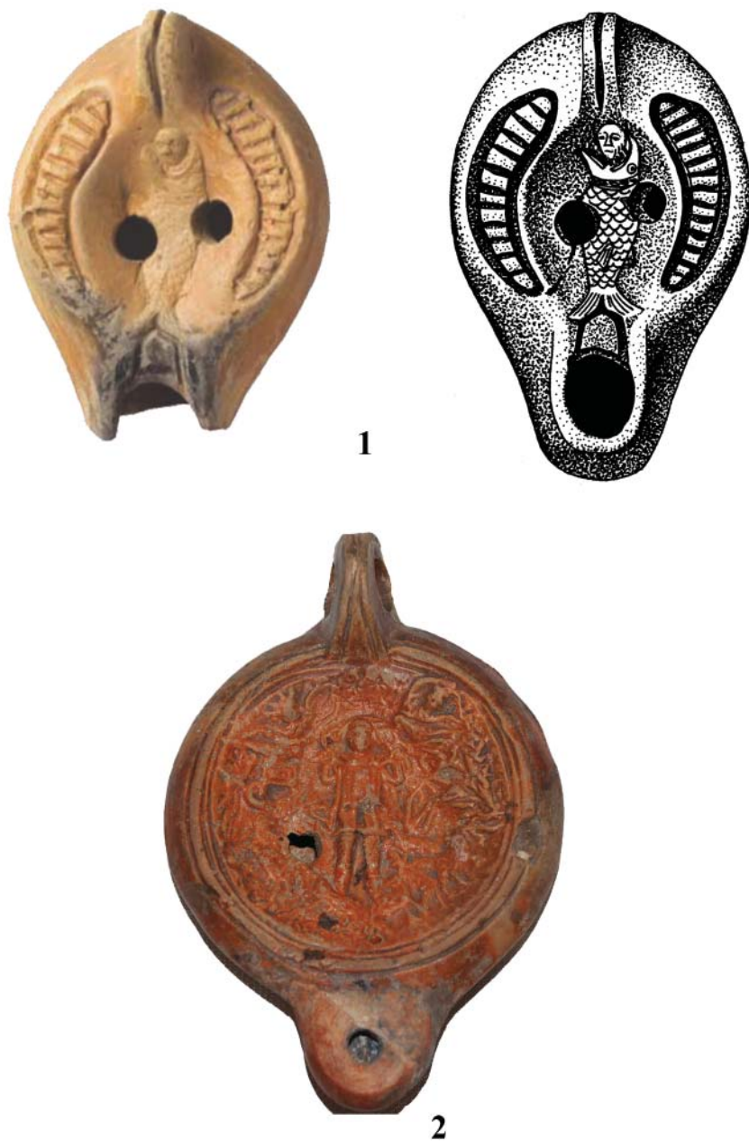
Рис. 3. Светильники с изображениями Ионы: 1 – ГИМ (фото И.А. Седенькова (после реставрации); рис. А.Н. Трифоновой (до реставрации); 2 – Музей Боде, Берлин. Фото Д.В. Журавлева.

Fig. 3. Lamps with depiction of Jonah: 1 – State Historical Museum, Moscow. Photo: I.A. Sedenkov (after restoration); drawing: A.N. Trifonova (before restoration); 2 – Bode Museum, Berlin. Photo: D.V. Zhuravlev.