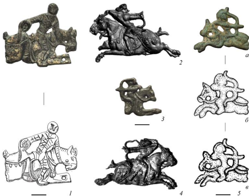
Рис. 4. Всадник на «летающем» коне. 1 – район городища Шиш-Тюбе, Чуйская долина; 2, 4 – Копенский чагас, к. 6, Минусинская котловина (по: Киселев 1949, табл. XLII, 1, 2, 4); 3 – ущелье Кашка-Су, Северный Тянь-Шань; 5 – Иссык-Кульская котловина, Северный Тянь-Шань: а (по: Ставская и др. 2013, 52); б (по: Худяков 2014, 43, рис. 3); в (по: Борисенко, Худяков 2018, рис. 1, 4). 2, 4 – без масштаба