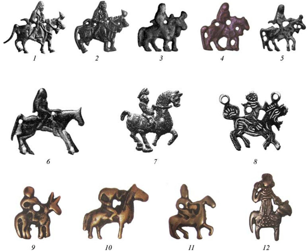
Рис. 3. Бляхи (без горизонтальной полосы в основании) в виде всадников «тюркской» традиции (1–6) и аналогии иных традиций (7–12). 1 – р. Чикой, Южное Забайкалье (Н 3,7 см) (по: Михно, Петри 1929, 323); 2 – городище Канка, средневековый Чач, Узбекистан (Н 3,7 см) (по: Средняя Азия... 1999, табл. 45, 4); 3 – городище Ходжент, средневековая Фергана, север Таджикистана (Н 3 см) (по: Древности Таджикистана... 1985, 327, кат. 836); 4 – Ордос (Северный Китай, Внутренняя Монголия) (по: Gudrun 2006, 126. VM-286 (Н 3 см)); 5 – Уты, Минусинская котловина (Н 2,9 см – измерено автором по оригиналу) (по: Tallgren 1917, pl. IX, 10); 6 – Ордос, Северный Китай, Внутренняя Монголия (по: Egami, Mizuno 1935, t. XLV, 11); 7, 8 – граница Северного Китая (по: Salmony 1933, pl. XVI, 5, 6); 9–12 – Тибет (по: Gudrun 2006, 126, FII-284 (Н 2,8 см), R-280 (Н 3,1 см), G-283 (Н 3 см), S-287 (Н 6,3 см)). 6–8 – размеры неизвестны

Fig. 3. Plaques (without a horizontal strip at the base) shaped as horsemen of the “Turkic” tradition (1–6) and their analogies of other traditions (7–12)