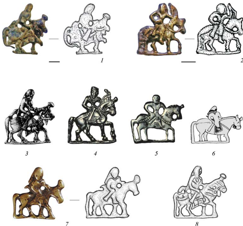
Рис. 2. Бляхи (с горизонтальной полосой в основании) в виде всадников. 1, 2 – Чуйская долина (по: Борисенко, Худяков 2018, рис. 1, 1, 2; 2, 1, 2); 3 – Бирский, п. 362, Южный Урал (Н 4,4 см) (по: Мажитов, Султанова 1994, 113); 4, 5 – Колмаково (Н 4,6 см), Сабинское (Н 4 см), Минусинская котловина (ММ); 6 – Южная Гоби, Монголия (Н 3 см) [по: Волков 1965, рис. 1, 2]; 7, 8 – Монголия: фото (Н 3,5 см) (по: Тэнгэрийн илд 2011, 74, кат. 40), рисунки (по: Худяков 2013, 210). 8 – размер неизвестен

Fig. 2. Plaques (with a horizontal strip at the base) shaped as horsemen