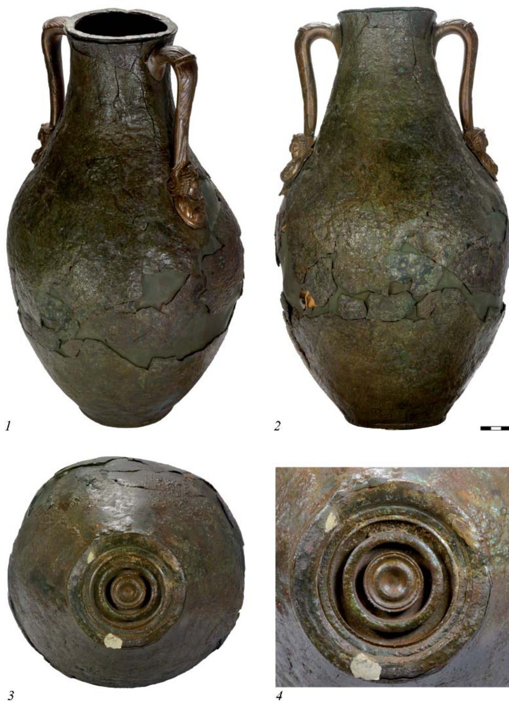
Рис. 2. Хут. Кудинов. Курган № 14/1961. Погребение № 1. Амфора бронзовая. Государственный Эрмитаж. Общие виды.