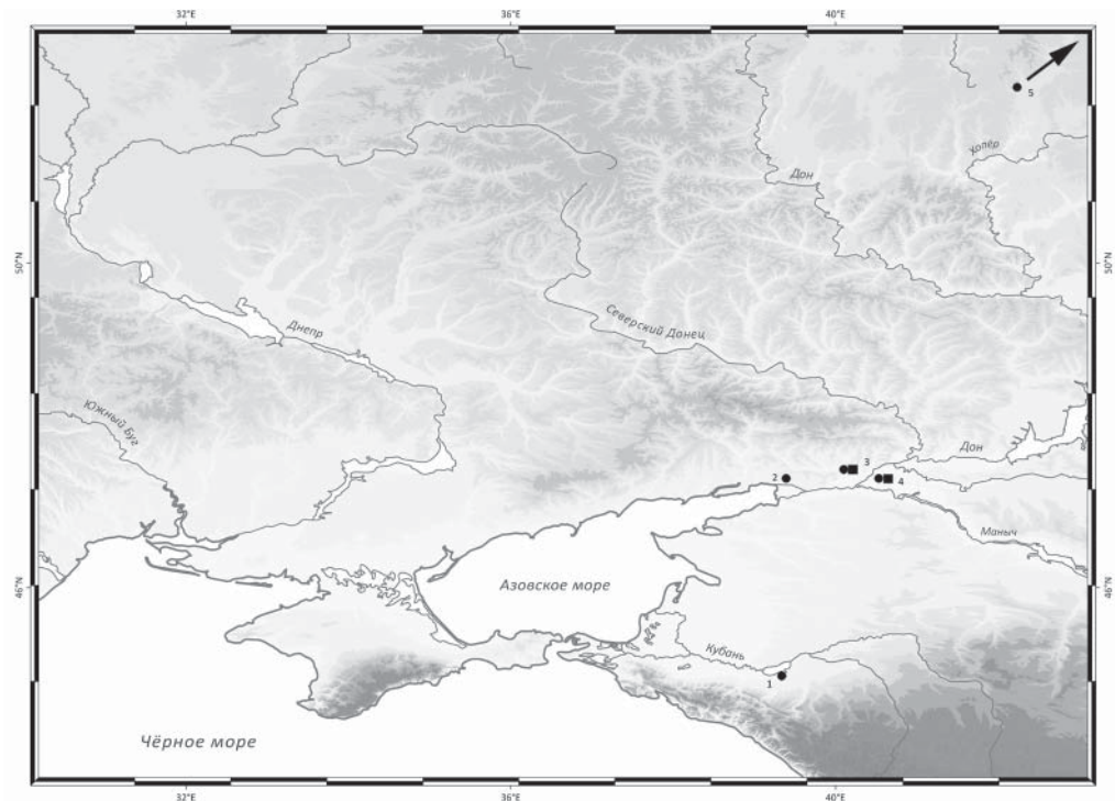
Рис. 1. Римские бронзовые амфоры в Сарматии. Карта (М. Трейстер, 2018). Подоснова Г.П. Гарбузова. Квадраты – амфоры формы Tassinari A3212, кружки – амфоры формы Tassinari A3220. 1 – Кончукохабль, 2 – курганный могильник Валовый I, 3 – курган Хохлач, 4 – курганный могильник у хут. Кудинов, 5 – курганный могильник Горелый I

в Помпеях и в Чаталке во Фракии, предполагал, что на Дон этот сосуд не мог попасть ранее 70-х гг. н.э. 10