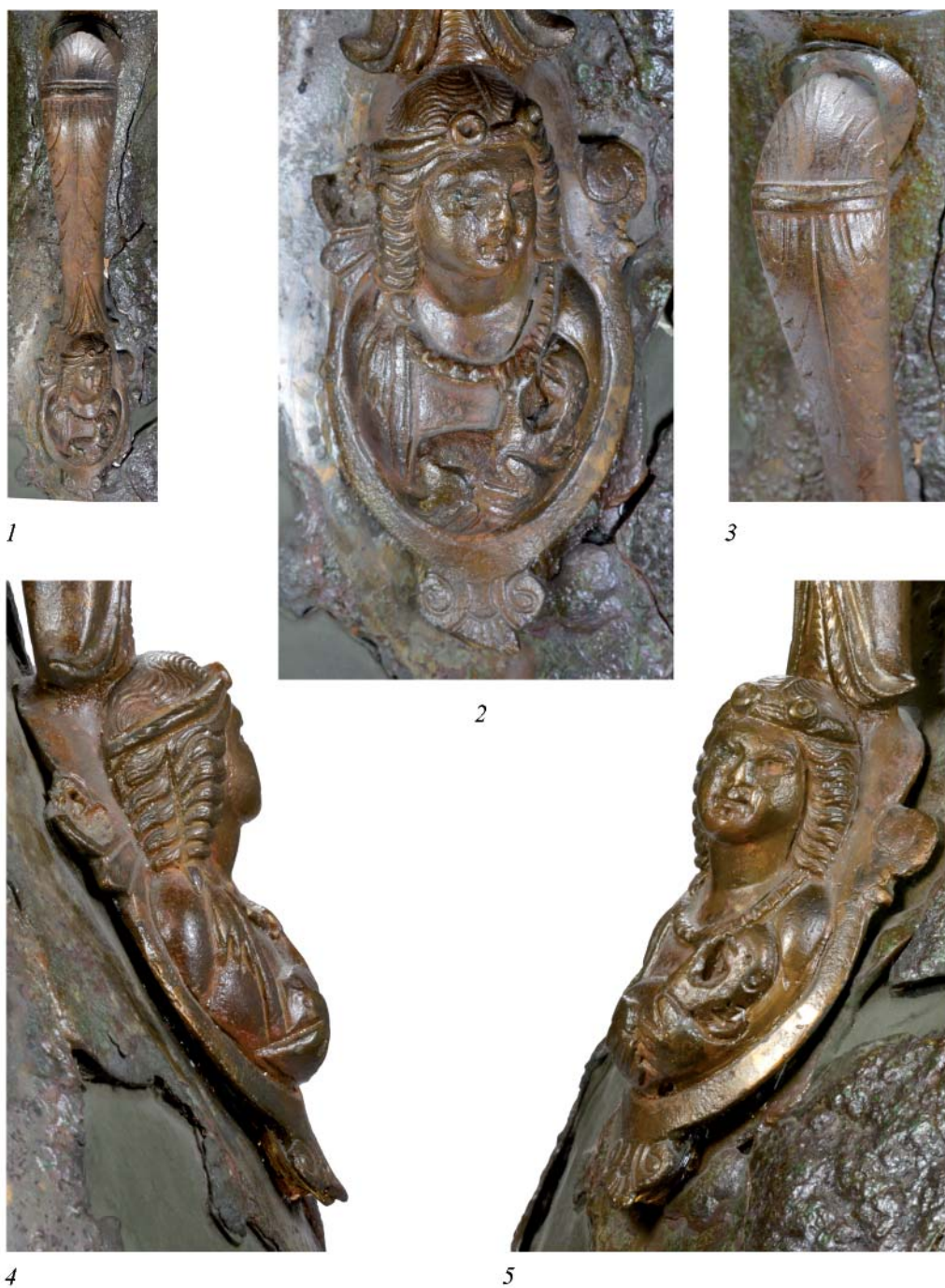
Рис. 5. Хут. Кудинов. Курган № 14/1961. Погребение № 1. Амфора бронзовая. Государственный Эрмитаж. Ручка 2. Детали.