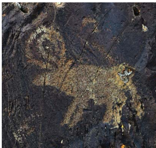
Рис. 6. Цааган-Салаа, Монголия