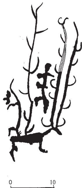
Рис. 3. Мозага-Хомужап, Тува (прорисовка М.А. Дэвлет)