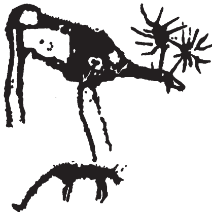
Рис. 1. Цааган-Салаа IV (по Кубарев и др. 2005, рис. 512)

Среди изображений животных, наделенных фантастическими чертами, известны образы, которые формировались путем умножения отдельных частей тела, – многорогие, многоухие, многокрылые, многоногие персонажи 6 . Подобные ирреальные образы встречаются также и в фольклоре коренных народов Северной и Центральной Азии. Это как хтонические существа нижнего мира, так и персонажи, олицетворяющие светлые небесные силы. Верхом на девятирогом черном быке ездит владыка подземного царства