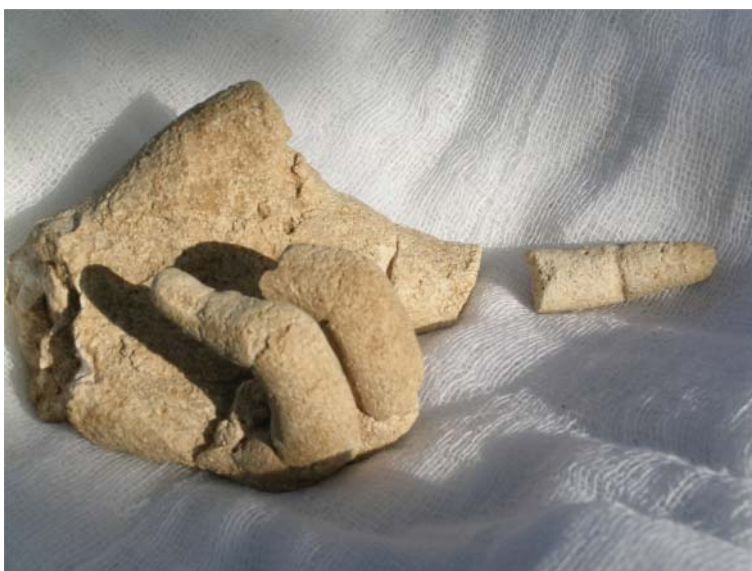
Рис. 10. Кисть левой руки с вытянутым вперед указательным пальцем