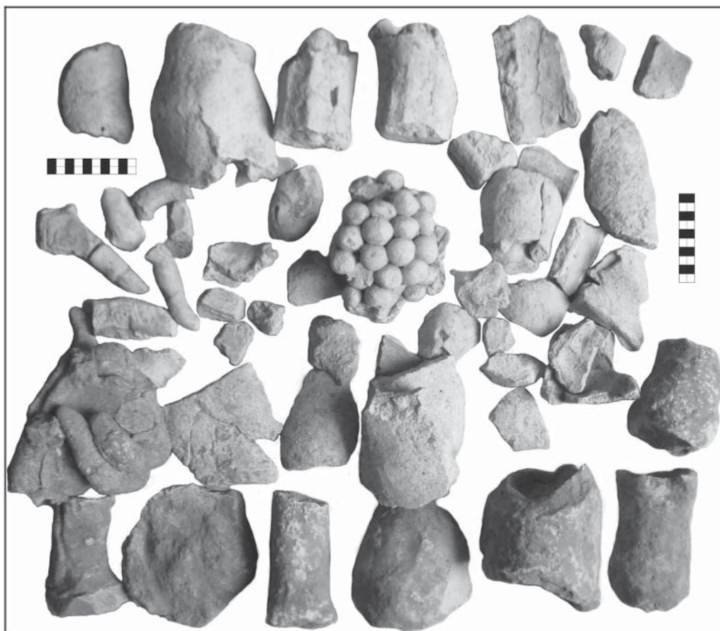
Рис. 1. Старая Ниса. Башенное сооружение. Часть фрагментов гипсовой скульптуры из юго-восточного мусорного сброса

ских археологов и реставраторов, неожиданно оказавшихся в Туркменистане в ранге иностранцев. Финансирование их работы прекратилось как с одной, так и с другой стороны. Сроки пребывания в Ашхабаде были ограничены. Вывоз находок в Москву даже временно для проведения реставрационных работ был категорически запрещен. В этих условиях мне удалось найти время лишь на то, чтобы высушить подмоченные экспонаты и составить их краткое описание. В обнаруженном ящике находились остатки нескольких однотипных антропоморфных фигур. Судя по величине относительно хорошо сохранившихся рук, в полный рост эти фигуры имели бы высоту около 1 м. Но сразу следует отметить, что фрагменты, соответствующие изображению ног, пока зафиксировать не удалось. Для более детального изучения данного материала требовалось активное участие опытного реставратора. Но возможности привезти его в Ашхабад у меня уже не было. По этой причине полная обработка коллекции до сих пор не проведена, и ниже предлагается краткое предварительное сообщение об этих редких для Нисы находках.