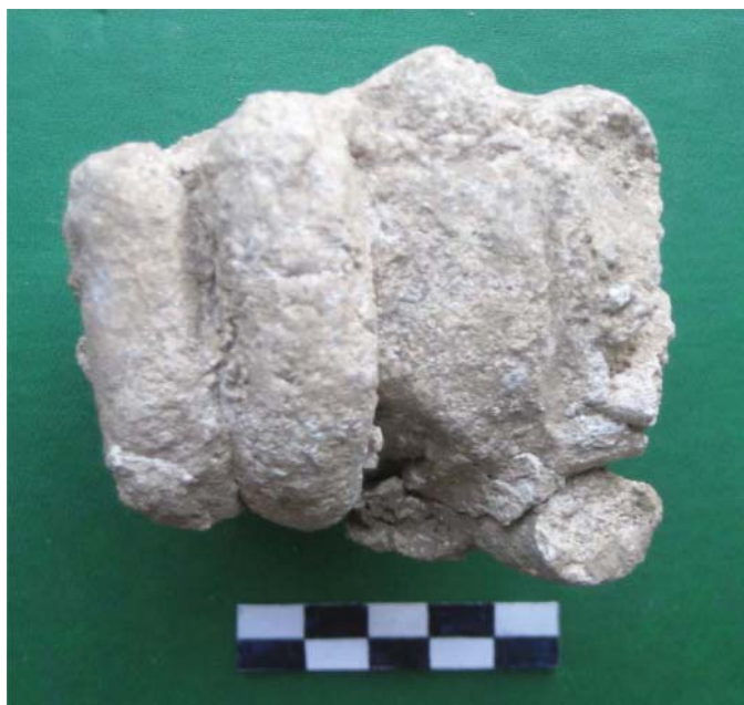
Рис. 7. Кисть правой руки, сжатая в кулак