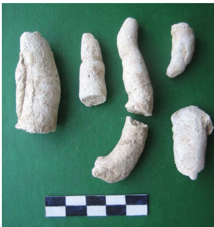
Рис. 11. Старая Ниса. Башенное сооружение. Юго-восточный мусорный сброс. Пальцы рук

Но и на стадии предварительного изучения фрагментов, изображения рук дали ответы на два важных вопроса. Благодаря им установлено, что в коллекции присутствуют остатки нескольких однотипных изваяний, которые дают возможность примерно определить их метрические параметры. Если представить, что это были изображения в полный рост, то рассматриваемые статуи должны иметь высоту около 1 м. Однако их позы и формат исполнения пока нельзя точно определить.