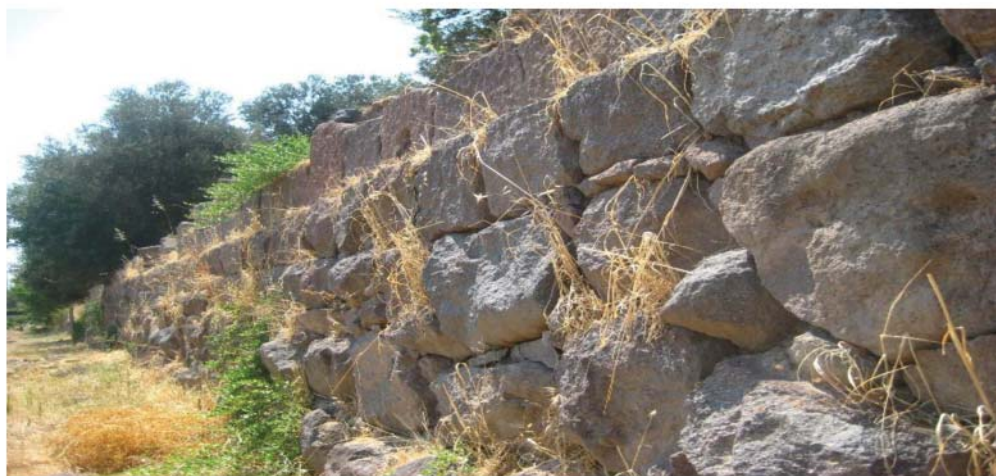
Рис. 2. Стены Смирны. Первая половина VI в. до н. э. Северо-восточный участок.

бон, смирнейцев вытеснили из этого поселения эолийцы. Ионийцы же Смирны нашли убежище в Колофоне. Колофоняне помогли смирнейцам вернуть Смирну.