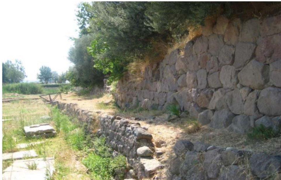
Рис. 3. Стены Смирны. Первая половина VI в. до н. э. Юго-восточный участок.