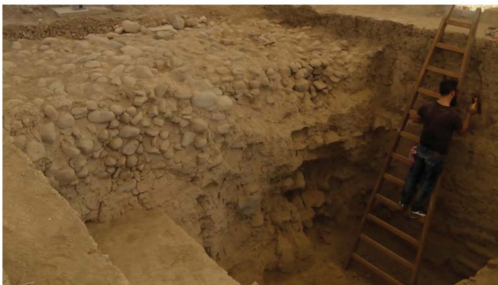
Рис. 1. Стена Смирны середины IX в. до н.э. Сырцовый кирпич.

колофонянами. Об этом свидетельствует и местная традиция, стихи из поэмы «Нанно» колофонского поэта VII в. до н.э. Мимнерма (fr. 3 Gentili–Prato) 4 :