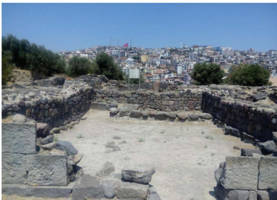
Рис. 8. Большой мегарон. Конец VII в. до н. э.