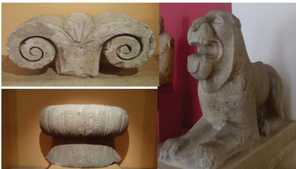
Рис. 7. Статуя льва и фрагменты капители из храма Афины (VI в. до н. э.). Измир. Музей истории и искусств.