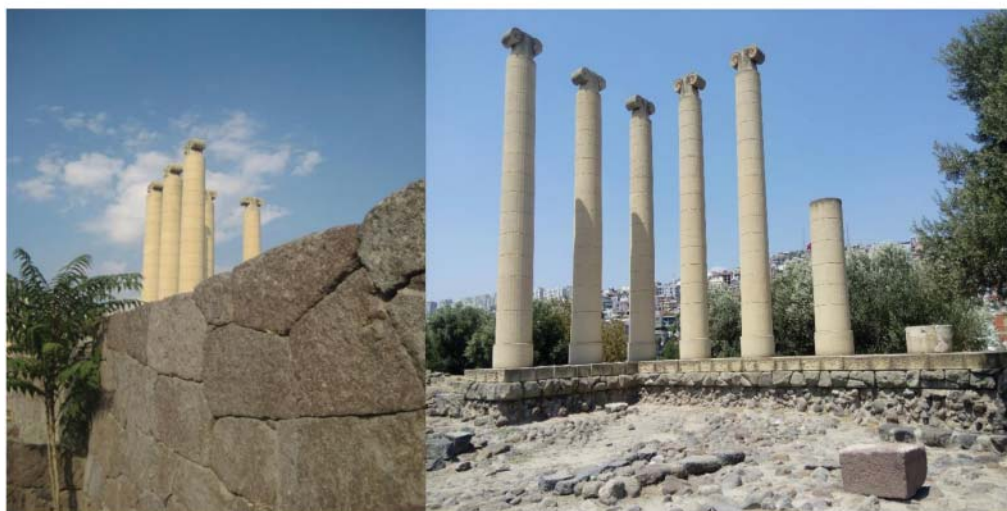
Рис. 6. Храм Афины.