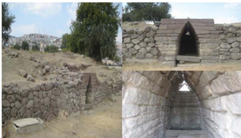
Рис. 5. Юго-восточный участок оборонительной стены. Фонтан. Конец VII в. до н. э.