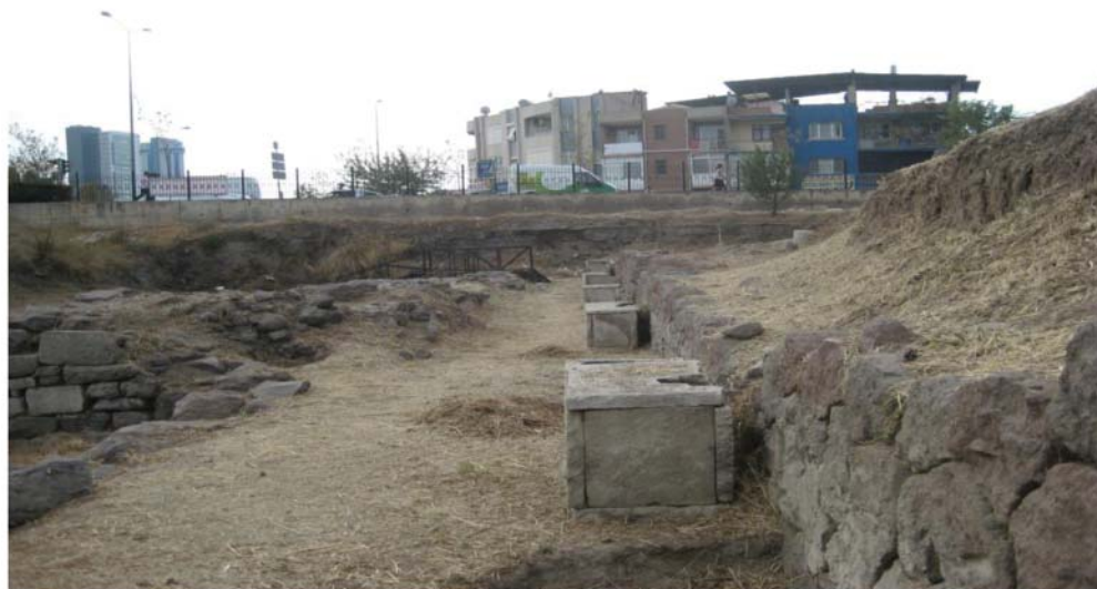
Рис. 4. Юго-восточный участок стен и некрополь.