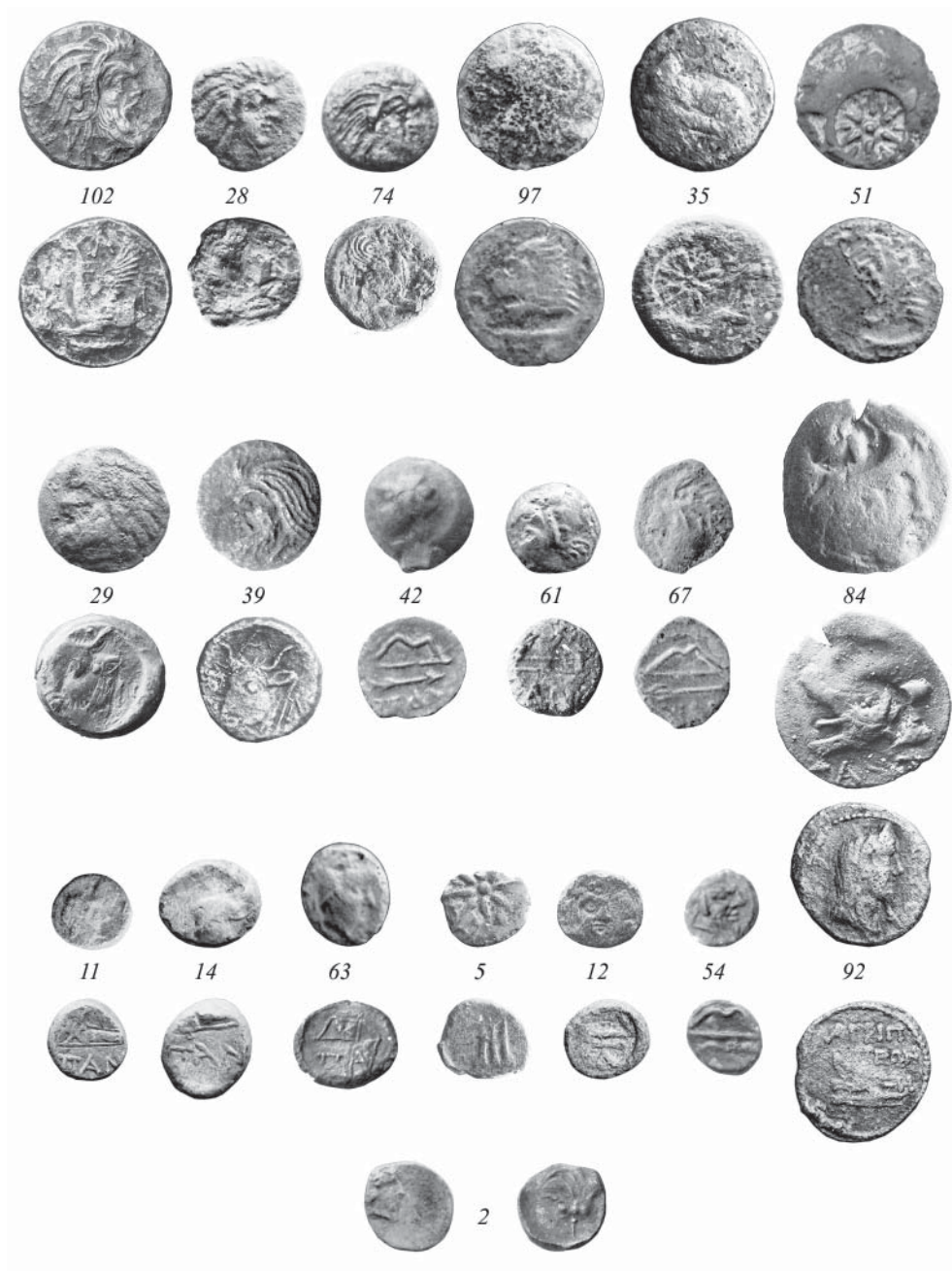
Рис. 1. Монеты IV-I вв. до н.э. из раскопок поселения и некрополя Виноградный 7 (Пантикапей и Фанагория)