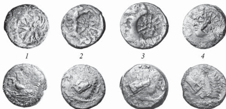
Рис. 2. Пантикапейские монеты нач. III в. до н.э. из клада или кошелька с поселения Виноградный 7

(и Горгииппии) в условиях прогрессирующего социально-политического кризиса в государстве Спартокидов на Родос – могущественную морскую державу того времени 24 .