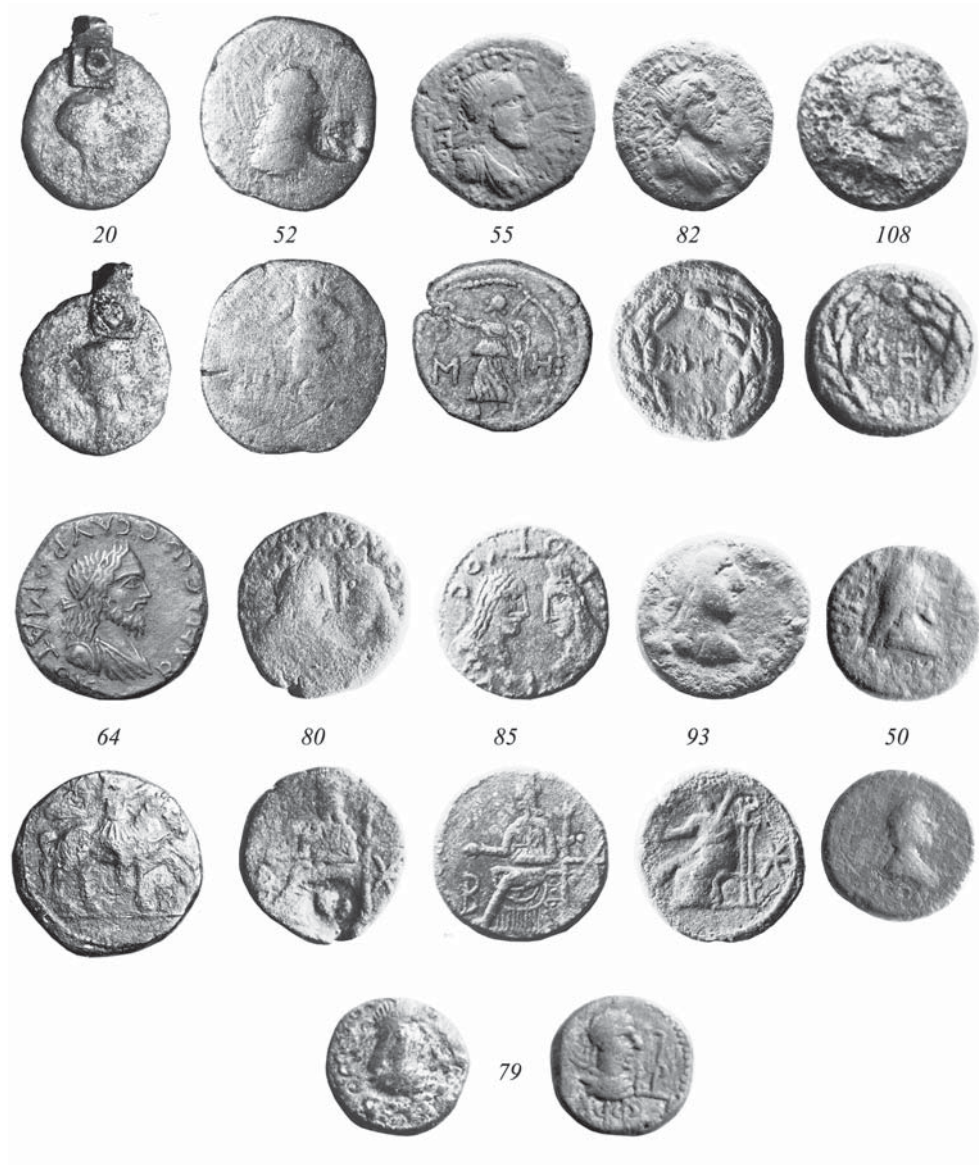
Рис. 3. Монеты Боспорского царства I-III вв. н.э. из раскопок поселения Виноградный 7.

Боспорская царская чеканка представлена единичными экземплярами монет от неизвестного династа ΒΑΕ (№ 124) (конец I в. до н.э.) и Аспурга (№ 83) до Рескупорида VI (№ 87). Из 19 монет этой группы всего 2 относятся к I в. н.э.; 5 экз. — ко II в. н.э.: сестерций Савромата I (рис. 3, 52), сестерции и двойной денарий Савромата II (рис. 3, 55, 64, 82, 108). Ровно половина монет приходится на III в. н.э.: денарий Рескупорида III (№ 77), двойные денарии Котиса III (рис. 3, 80, 85), Савромата III (рис. 3, 93), Инифимея (№ 116); статеры Рескупорида V (№ 120), Тейрана (рис. 3, 50) и Фофорса (рис. 3, 79).