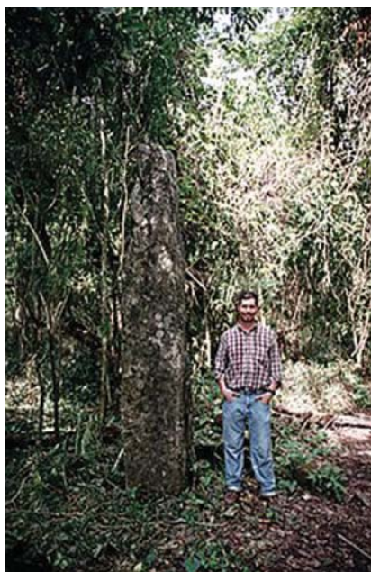
Рис. 2. Стела «Ла Пикота» из городища Паленке, Мексика