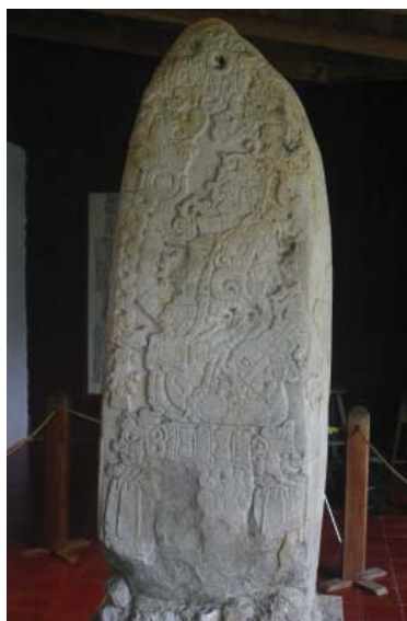
Рис. 4. Стела 31 (445 г.) из городища Тикаль, Мексика

Дополнительный аргумент в пользу отождествления стел с жадеитовыми кельтами являются раннеклассические материалы из Копана. Речь идет о стеле 63, которая была освящена четвертым царем династии, чтобы почтить присутствие его предка, второго царя династии при ритуале окончания большого календарного цикла 9.0.0.0.0 (435 г.) 24 . Эта стела почти два века служила центром церемониальных действий и была погребена внутри закрытого святилища Папагайо. Стела названа в тексте LAKAM-LEM – lakam le'm («большой кельт») вместо более обычного термина lakam tuun («большой камень»).