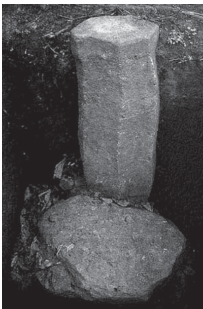
Рис. 1. «Гладкие» стелы из городища Эль-Наранхо, Гватемала

На археологическом памятнике Эль-Наранхо (Гватемала) среднего доклассического периода (1000–400 до н.э.) были найдены свидетельства религиозной традиции, связанной с культом «гладкой» стелы. Эль-Наранхо в дополнение к изолированным памятникам и алтарям, разбросанным по городищу, имеет три основные группы объектов, ориентированных по одной линии. Там также были обнаружены гладкие базальтовые стелы в форме колонны 17 , которые датируются 750 до н.э. и являются одними из первых культовых недекорированных монументов в Мезоамерике. Они расположены по направляющей оси и являются структурообразующими для центральной площади городища. Для церемониального общественного пространства классического города майя было характерно строительство так называемых «патио-групп» – построек, располагавшихся по четыре стороны от центральной площади, в середине которой, как правило, находились группы стел. В Эль-Наранхо религиозная практика выстраивания стел по одной линии играла очень важную роль. Прямоугольная форма и гладкость одной (фронтальной) стороны стелы служили предпосылкой для отбора и установки недекорированных стел (рис. 1).