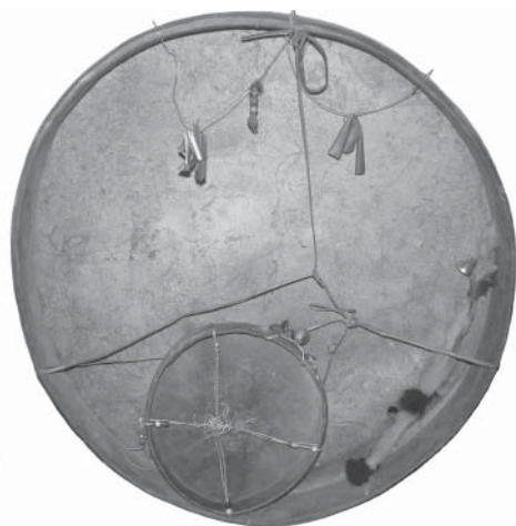
Рис. 1. Бубны корякские. Владелица корячка Стекольщикова Н. А., уроженка с. Верхний Парень. В настоящее время переданы и хранятся в Магаданском областном краеведческом музее, инв. № КП-33424, 33425. Размер бубнов: большой 70х65х7,5 см; маленький 28х25х3,5 см.