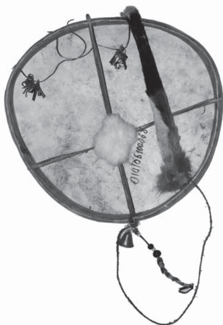
Рис. 3. Бубен корякский. Владелец коряк Иньлив Ю.В., с. Верхний Парень (ранее принадлежал шаману Захару Тумухаю). Передан и хранится в музее пос. Эвенск, инв № 1996/1, этн-193/1. Размер 50х48х5,3 см.