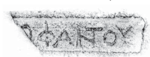
Рис. 2. Протирка амфорного клейма с именем Диофанта

Замечания А.В. Ковальчук касаются двух клейм: она считает чтение имени