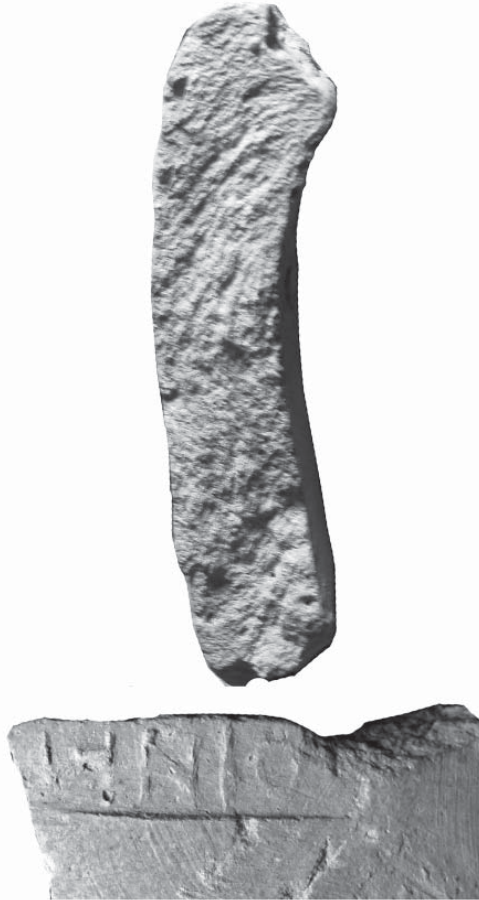
Рис. 5. Боспорское амфорное клеймо с именем Аполлоний

Умиляет подсчет А.В. Ковальчук количества строк, которое я уделил каждому автору. Напомню Анне Витальевне, что каталог подписан моей фамилией и это авторский текст, который не нормируется количеством строк. А с другой стороны, вот какое количество строк я посвятил А.В. Ковальчук!