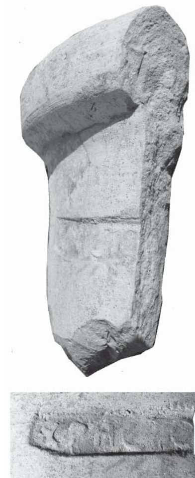
Рис. 4. Боспорское амфорное клеймо с именем Хрест

Между тем, эти замечания – повод еще раз обратиться к боспорским амфорным клеймам. Мною планировалась издать отдельную статью, посвященную этому материалу, для которого были изготовлены рисунки профилей амфор (рис. 3), но сборник не состоялся. Пользуясь случаем, я публикую эти рисунки. На таблице изображены не только боспорские клейма, но и рисунок амфоры (рис. 3.7), предположительно на которую наносились эти клейма 33 , горло амфоры с клеймом ХРН (рис. 3.6) и аналогичное клеймо на синопской черепице с именем Хрест. Новое боспорское клеймо с этим именем я привожу на рис. 4. Клеймо из раскопок Артезиана в 1995 г. (№46, кп134341/ккк17880) 34 , рельефное, расположено на горле, под венчиком. Легенда ХРНΣ-ТО[Υ]. Имя уже встречено среди других боспорских клейм. Обращает на себя внимание написание буквы омикрон – она такая же крупная, как и в клейме Диофант, в восстановлении которого сомневается А.В. Ковальчук.